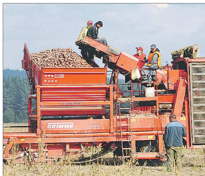
В 2016 году посевная площадь в Свердловской области составит 813 тысяч гектаров. В планах — собрать с них не менее 670 тысяч тонн зерновых культур и 748 тысяч тонн картофеля

Свердловская область и Федерация достигли соглашения о финансировании проекта строительства семеноводческого центра «Уральский картофель». Проектно-сметная документация уже прошла госэкспертизу. Сбербанк выделит кредит на реализацию проекта в размере 93,6 миллиона рублей. Осенью ожидается начало строительства. Проект «Уральский картофель» предусматривает производство элитных сортов семенного картофеля российской селекции в объёме 10 тысяч тонн в год. Это позволит заменить импортный семенной картофель, который сегодня закупается по цене 115 рублей за килограмм, поможет снизить его себестоимость.