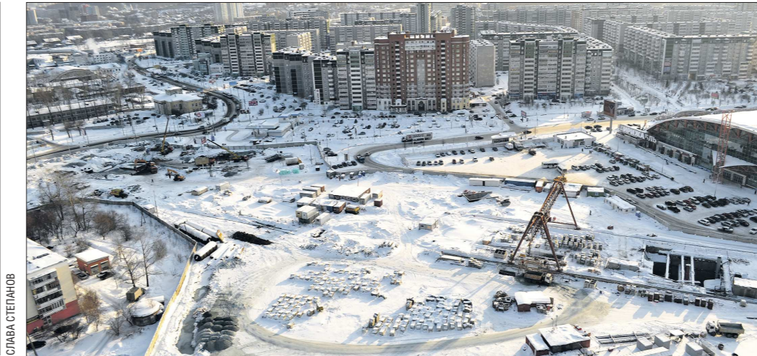
В проектировании интерьера метро участвовал музыкант Вячеслав Бутусов... архитекторского института. Он сделал чертежи облицовки колонн для станции «Проспект Космонавтов» и вычертил буквы в названии станции «Уралмаш»