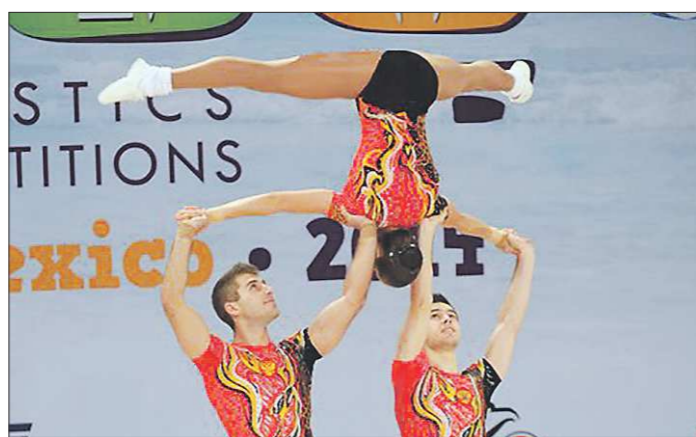
Для выполнения акробатических элементов требуется хорошая физическая форма, поэтому тренируются спортсмены трижды в день