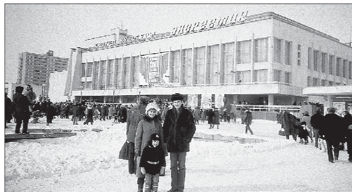
На фото слева — город Припять, Дворец культуры «Энергетик» примерно за месяц до аварии, в марте 1986 года. Справа — уже после аварии, в начале 2000-х годов...

И в школе, и в лётном училище проходили это на военной подготовке. Но понять, какую дозу облучения получали, было сложно. На борту