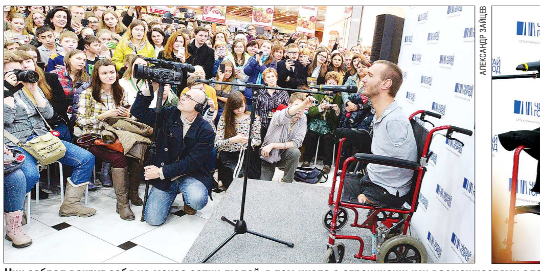
Ник собрал вокруг себя не менее сотни людей, в том числе с ограниченными возможностями здоровья