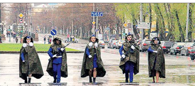
В течение всего года юнармейские отряды и военно-патриотические клубы будут участвовать в конкурсе на звание «Лучший отряд почётного караула»

В этом году на площади Коммунаров в начале будничности почётную службу 45 лучших юнармейских отрядов и семь военно-патриотических клубов из городов и сёл области.