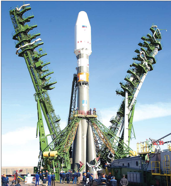
Так выглядит предстартовая подготовка космического «грузовика» «Союз-2», который стал практически единственным средством доставки грузов на МКС. Место действия — космодром Байконур

— Ваше предприятие специализируется на системах управления. Помните, на десятилетия первого пуска «Союза-2», оснащённого вашей аппаратурой, вы сказали, что наша задача — вывести ракету с грузом на расчётную орбиту. Занимает этот процесс минут десять, но это очень длин-