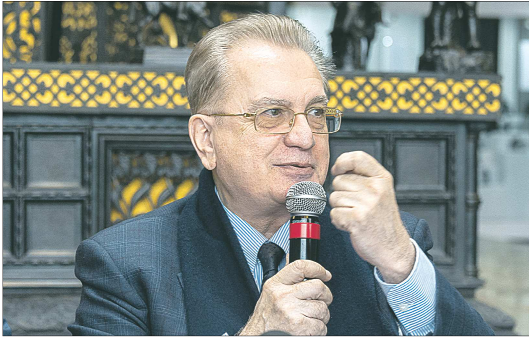
«Сегодня мы ещё раз убедились, что проект «Эрмитаж-Урал» нужен людям, что это важная часть духовной жизни региона», — подытожил Михаил Пиотровский

— Для нас это повод ещё раз сказать, что нет ничего важнее культуры и культурного наследия. Мы очень много говорили о Пальмире, особенно в России, и сегодня это имеет свои плоды. Приступить к восстановлению, конечно, ещё рано. Пока там небезопасно: всё заминировано, бои идут совсем рядом. Как только войска разминуют территорию, мы с коллегами из других музеев мира, сирийскими коллегами пересчитаем там все камни и вместе будем решать, что делать. Сегодня наша задача — собрать все имеющиеся материалы о Пальмире и привести их в порядок. Сейчас гото-