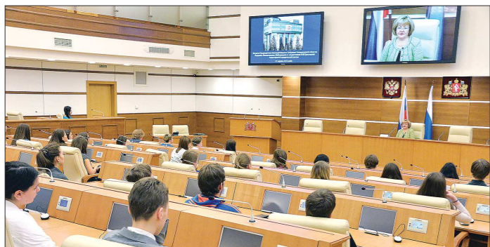
Школьников на встрече было много, и чтобы все вошли в зал, их пришлось разбить на две группы