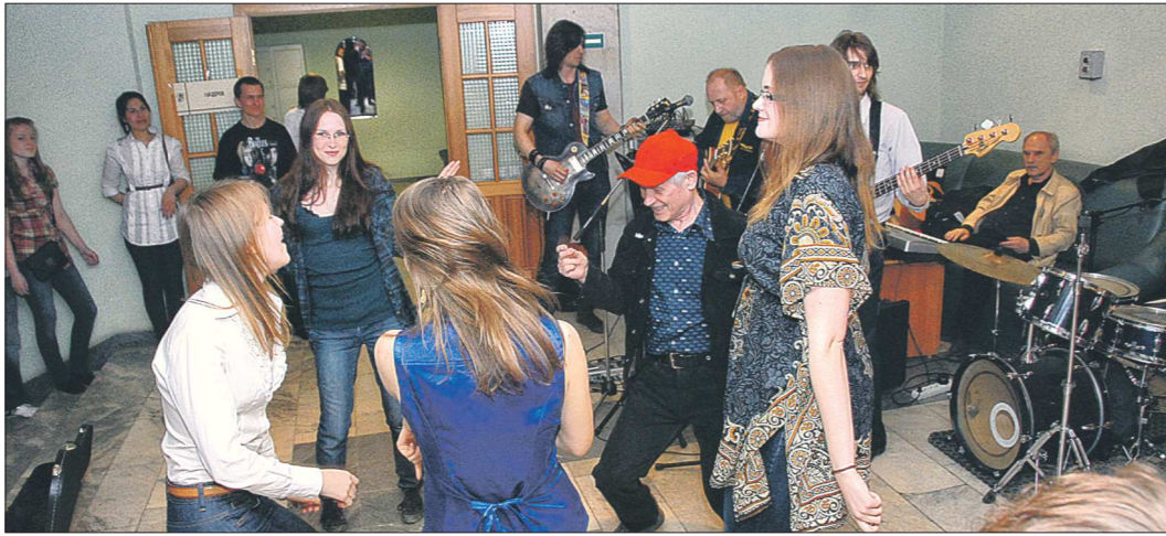
«Рок-н-ролл этой ночью»... в Свердловской областной библиотеке имени Белинского

Боле того, все эти «ночи» практически не отличаются друг от друга содержанием, и, когда в определенный момент СМИ снова при-