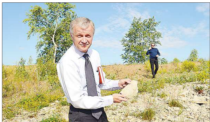
Вновь избранный глава в работе опирается на народную мудрость: «Под лежачий камень вода не течёт»