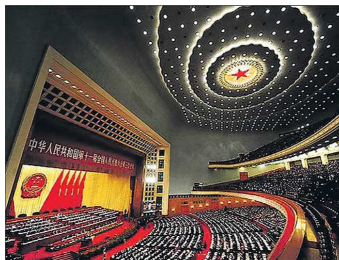
На сессии ВСНП обсуждалась, в частности, проблема «предприятий-зомби», касающаяся перенасытия производственных мощностей в металлургической, угольной и других отраслях промышленности, которые оказались в трудном экономическом положении

ми в следующую пятилетку. Например, в сфере атомной энергетики, строительстве высокоскоростной железнодорожной магистрали (ВСМ) Москва — Пекин. В этом или в следующем году будет начато строительство участка ВСМ от Москвы до Казани. На Дальнем Востоке, где граничат две страны, начнётся строительство трансконтинентальной автодороги и автомобильного моста. — Планирует ли китайская сторона принять участие в проектировании участка высокоскоростной железнодорожной магистрали от Казани до Екатеринбурга? — В целом строительство ВСМ Москва — Пекин осуществляется по договорённости между главами двух наших государств. Поскольку этот объект очень крупный, то в нём задействовано много министерств и ведомств обеих стран. Что касается интересующего вас участка, то пока Российские железные дороги ведут переговоры, где обсуждаются технические вопросы.