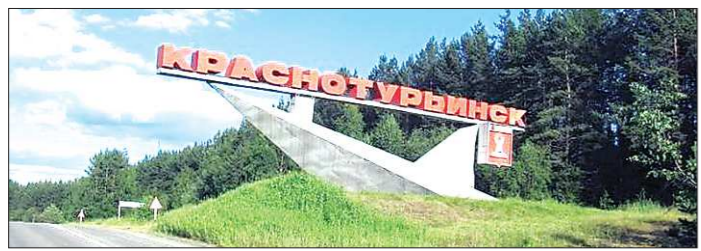
Новый статус позволит привлечь в Краснотурьинск в разы больше крупных гостей — инвесторов и предпринимателей