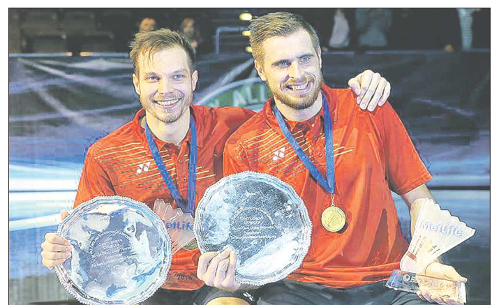
Тарелки победителям в парном разряде дают только поддержать, потом они остаются на хранении у организаторов

– Этой победой вы почти обеспечили себе путёвки на Олимпийские игры в Рио-де-Жанейро?