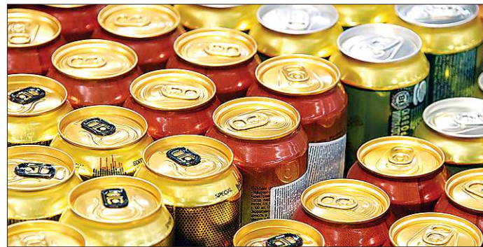
Опасные для молодёжи «энергетики» упакованы так, что внешне мало отличаются от безалкогольного сока

QR-код позволит вам с помощью сканирующего оборудования (в том числе и фотокамеры мобильного телефона) найти документы, опубликованные на сайте http://www.pravo.gov66.ru