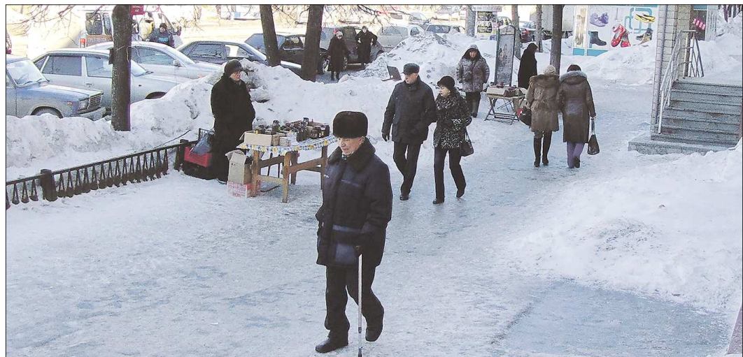
Ряды уличных торговцев на Мира — Ленина в Нижнем Тагиле в последнее время заметно поредели. Регулярные рейды и штрафы сделали своё дело. Но самые стойкие своих мест не покидают

Официальный колхозный рынок в Нижнем Тагиле приказал долго жить — там с недавних пор базируется торговый центр. Зато есть несколько нелегальных: бабушки, расположившись на асфальтах, торгуют на центральных улицах прямо посреди тротуара. Каждый из тагильских мэров пробовал направить уличную торговлю в цивилизованное русло, но все потерпели неудачу. Сейчас городские чиновники начали очередную кампанию по переселению корейников в намеченные мэрские точки.