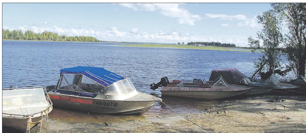
Луговской (население — около 1,5 тысячи человек) расположен на берегу Оби

45 лет назад — 16 марта 1971 года — в небольшом посёлке Луговском, что в 30 километрах от Ханты-Мансийска, родился Евгений Куйвашев. В 2012 году он стал губернатором Среднего Урала. Накануне этой даты «ОГ» нашла людей, которые знали нынешнего главу со времён его детства