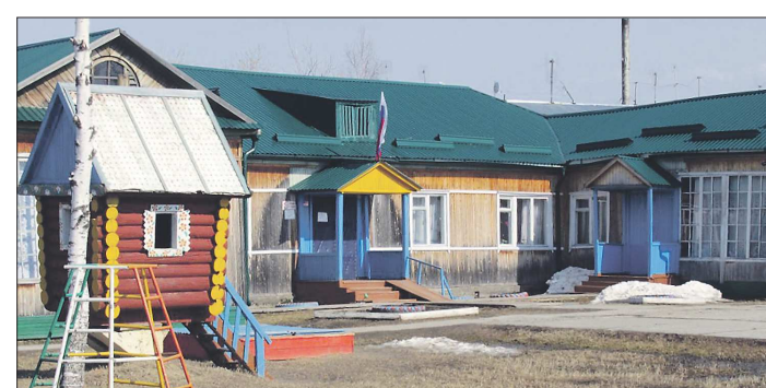
Детский сад, который посещал Евгений Куйвашев, когда жил в Луговском, функционирует до сих пор