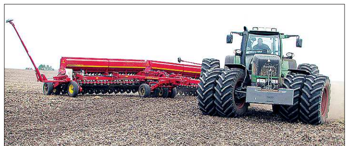
Сегодня ремонт двигателя импортного трактора по стоимости может обойтись как покупка нового отечественного