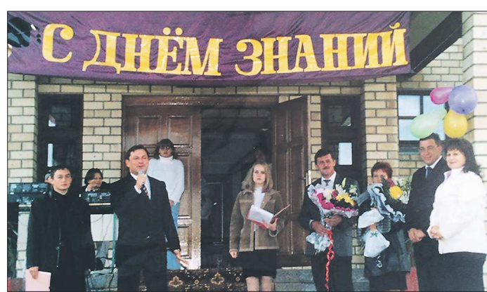
В конце 90-х годов Евгений Куйвашев работал в посёлке Пойковском — сначала помощником главы администрации, а затем и главой. На снимке: начало нового учебного года в Пойковском филиале ТюмГУ. Будущий глава Среднего Урала — второй справа