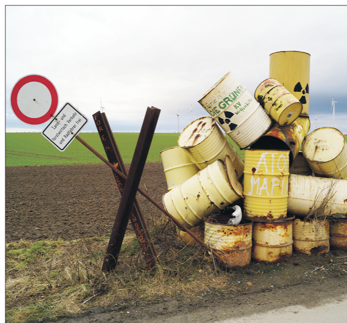
Такую инсталляцию активисты соорудили на въезде в «Конрад» в знак протеста против захоронения РАО

— Германия очень густонаселённая страна — здесь проживают около 80 миллионов человек, и при этом, в отличие от России, у нас нет возможности выделить для пункта захоронения безлюдные или малонаселённые районы. По моему проекту в течение установленных 72 дней было подано 290