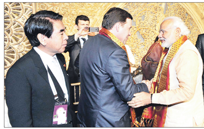
Губернатор Евгений Куйвашев и премьер-министр Индии Нарендра Моди (справа) обсудили подготовку Иннопрома-2016