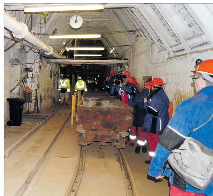
Ожидается, что первые партии отходов поступят в «Конрад» в 2022 году

В своё время «отец водородной бомбы» академик Андрей Сахаров сказал, что для человечества пока нет серьёзной альтернативы ядерной энергетике. До сих пор не нашли её и немцы, которые хоть и занимаются развитием ветроэнергетики, тем не менее вынуждены покупать относительно дешёвую электроэнергию у соседней Франции, которая около 75 процентов всей энергии производит на атомных станциях.