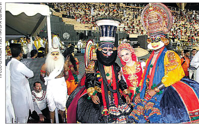
На Всемирном фестивале культур в Индии собрались 3,5 миллиона зрителей