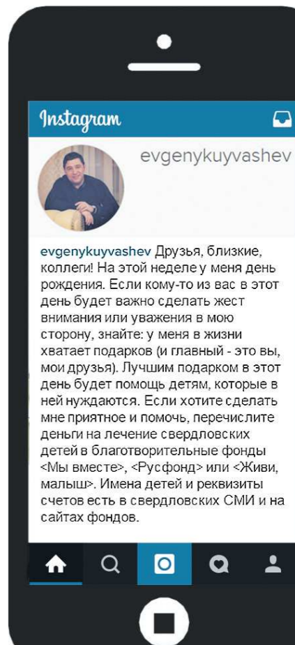
Вчера в инстаграме губернатора появилась новая запись

ляет экстренно вызвать на место ДТП оперативные службы, автоматически отправляя им точные местонахождение. Обращаясь к участникам заседания, Владимир Путин заявил, что денежные средства от штрафов отныне будут поступать в бюджеты регионов и использоваться целевым образом только на развитие дорожной инфраструктуры. Мнения муниципальных глав о том, как повысить безопасность дорожного движения