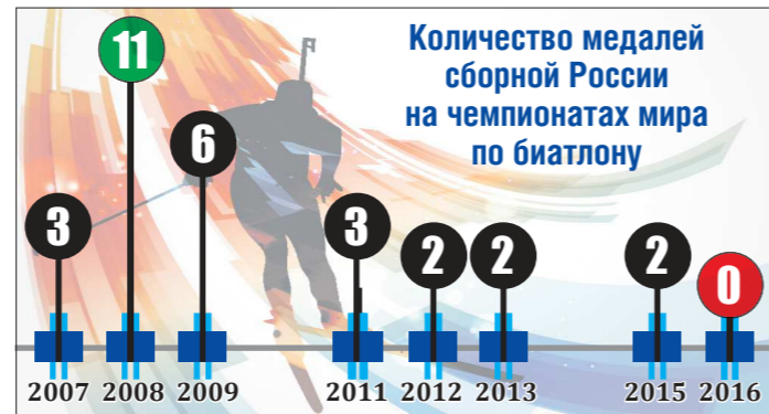
Количество медалей сборной России на чемпионатах мира по биатлону

И потом, Рикко не привлёк новых спортсменов, он начал работать с теми, кто есть. А то, что он не смог за один сезон сделать из средних (в последнее время) биатлонистов победителей, не умаляет его возможности как тренера. Более того, год назад, когда Гросс ещё не был старшим тренером мужской сборной России, наша команда на чемпионате мира в Финляндии тоже не блистала - тогда у мужчин была лишь одна медаль - у Антона Шипулина. Так что, скорее всего, ошибка не в тренере, а в самой системе подготовки. И пока создаётся впечатление, что у Гросса (впрочем, то же самое было и с другими тренерами) не хватает полномочий для того, чтобы