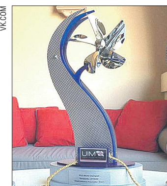
Так выглядит главная награда в водно-моторном спорте

Международная федерация водномоторного спорта (UIM) проводит чемпионаты мира в 74 классах судов. В 2015 году