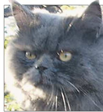
Домой Пушок вернулся усталым и исхудавшим, зато целым и невредимым

Спасая «мужское достоинство», шалинский кот Пушок покусал ветеринара, сбежал с операционного стола и почти месяц скрывался в подполье местной ветстанции, куда его принесли на кастрацию. На днях его наконец удалось изловить и передать хозяйке целого и невредимого.