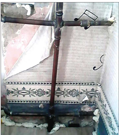
Заменяя трубу в качканарской квартире, ремонтники оборвали обои и продирали пол