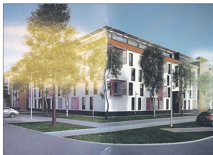
В проекте новый микрорайон в Берёзовском выглядит уютно и красиво, только строить его для молодых семей пока никому

— Стоимость строительства инженерной инфраструктуры к заявленному участку неизбежно войдёт в стоимость квадратного метра. А это в дальнейшем не позволило бы реализовать жильё по 35 тысяч рублей за квадратный метр в соответствии с условиями програм-