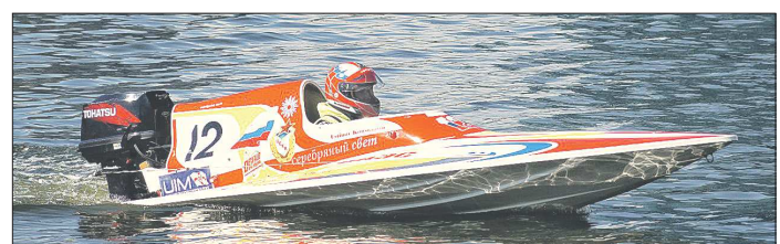
Стоимость лодки – 120 тысяч евро плюс винты, моторы, амуниция, транспортёрка лодки на соревнования, а самое главное – бензин. За час расходуется порядка 80–90 литров. У спортсменов есть спонсоры и федерация, цель которой – популяризировать спорт

Спортсмен из Каменска-Уральского в прошедшем году стал победителем чемпионатов мира в классе Endurance