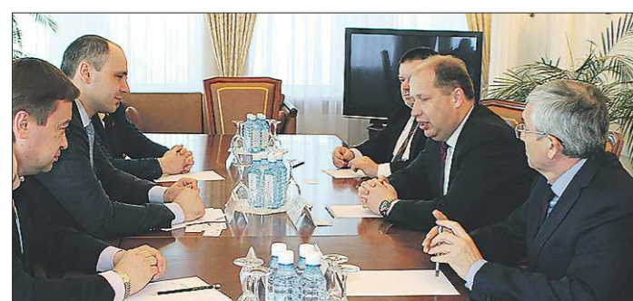
В числе перспективных направлений сотрудничества Среднего Урала и Словакии на встрече были названы лесопереработка, машиностроение и фармацевтика