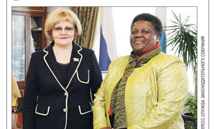
Вчера председатель Законодательного собрания Свердловской области Людмила Бабушкина встретилась с Чрезвычайным и Полномочным Послом Южно-Африканской Республики в РФ госпожой Номасонто Марией Сибандо-Туси . В ходе беседы Людмила Бабушкина подчеркнула, что руководство нашего региона заинтересовано в участии южноафриканских партнёров в ИИНОПРОМе и других международных форумах, организованных на уральской земле. Госпожа Сибандо-Туси отметила, что нужно усиливать торгово-промышленные отношения между российскими регионами и провинциями ЮАР