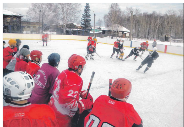
Открытый каток, на котором жизнь кипит с утра до вечера. Сосьве уже не хватает. При поддержке областного бюджета здесь может появиться и крытая спортивная площадка

Вообще-то с точки зрения обеспеченности спортивными объектами Сосьва, в которой почти 9 тысяч жителей, не самый проблемный муниципалитет в Свердловской области. Здесь есть и спортивный зал, и стадион (правда, без беговых дорожек), и каток. По словам той же Ольги Барматовой, работают кружки и секции, спортивные объекты загружены с утра до вечера. Есть ещё на Среднем Урале территории, которые и об этом могут только мечтать. Но аппетит, как известно, приходит во время еды: в Сосьве хотят построить универсальный спорт-корт, на котором