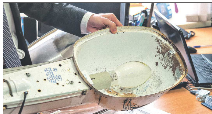
Старые металлические светильники быстро портятся и требовали в 2,5 раза больше энергии

В субботах двухметровой высоты жители не могли отыскать свои машины. За три последних месяца минувшего года на вывоз снега муниципалитет потратил почти четыре миллиона рублей, но и этого оказалось недостаточно. В феврале город вновь объявил конкурс на очистку дорог от снега. 2,3 миллиона рублей дополнительно выделено из городской казны, чтобы до апреля освободить от снега улицы города и прилегающих посёлков.