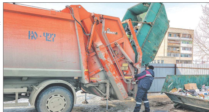
Специальный мусоровоз приезжает к бункерным накопителям не реже одного раза в сутки