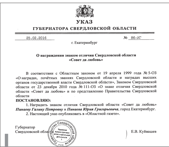
Подробнее об истории семьи Пинаевых читайте в «Областной газете» за 23 января 2016 года