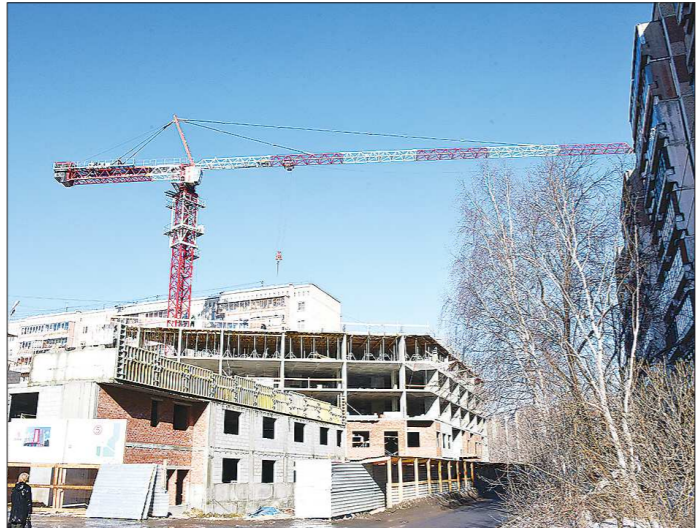
Новые здания в Екатеринбурге возводятся прямо во дворах так, что краны нависают над жилыми домами