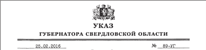
В соответствии с Областным законом от 19 апреля 1999 года № 5-О3 «О наградах, почетных званиях Свердловской области и наградах высших органов государственной власти Свердловской области», Законом Свердловской области от 23 декабря 2010 года № 111-ОЗ «О знаке отличия Свердловской области «За заслуги перед Свердловской областью» и представлению Правительству Свердловской области: