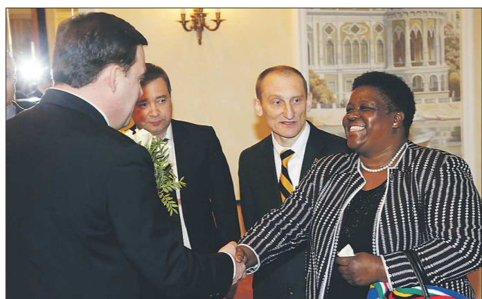
Южноафриканский дипломат прибыла в Екатеринбург вместе с руководителями крупнейших сельскохозяйственных предприятий ЮАР. С уральской стороны с африканцами встретятся представители около 60 компаний

В день открытия чрезвычайный и полномочный посол ЮАР в России госпожа Номасонто Мария Сибандатуси обсудила с губернатором Свердловской области Евгением Куйвашевым перспективы сотрудничества.