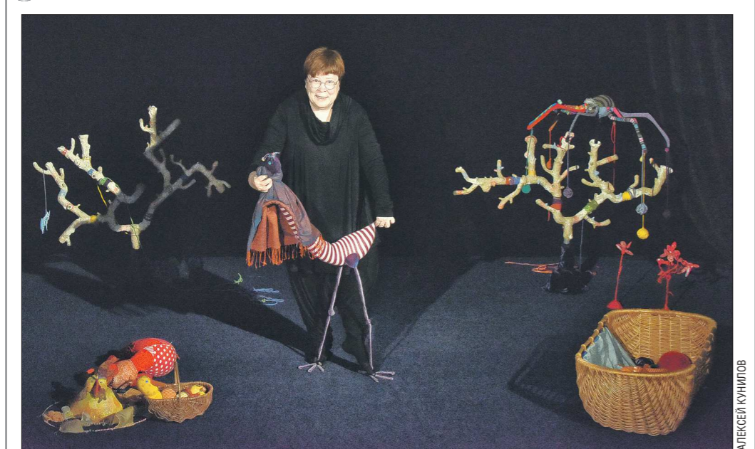
В Екатеринбургском театре кукол открылась новая сцена для маленьких зрителей. Раньше она находилась под самой крышей, и туда было неудобно подниматься. Теперь площадка располагается на первом этаже. Зал рассчитан на 40 мест. Откроется сцена премьерой спектакля «Разноцветные сказки» – елл посетит в жизнь заслуженная артистка России Наталья Гаранина (на фото). На месте нового зала ранее находился музей кукол, который уже в конце сезона откроется на пятом этаже