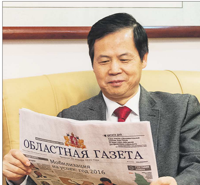
По мнению Тяня Юнсана, производители из Свердловской области могут занять достойное место на китайском рынке

На территории нашего консульского округа (это Уральский и Сибирский федеральные округа) ряд китайских компаний рассматривают и планируют деятельность