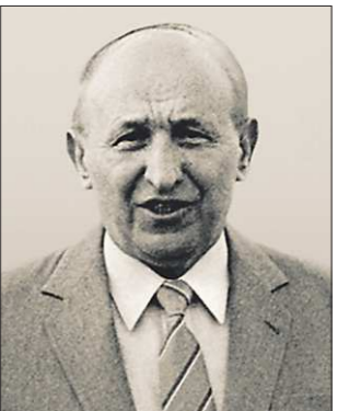
Тодору Живкову в 1981 году было 69 лет

35 лет назад (в 1981 году) Свердловск посетила делегация Болгарской коммунистической партии (БКП) во главе с первым секретарём БКП, председателем Госсовета Народной Республики Болгария Тодором Живковым.