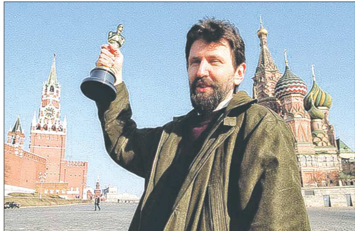
тебе не нужна, ты можешь её продать только академикам за сумму ровно в 1$. Раньше было так. Сейчас не знаю, к сожалению... А статуэтка стоит на полке с другими наградами и пылится. Гости приходят и просят с нею сфотографироваться. Я не отказываю.

– На самом деле я не знаю, чем там Бронзит таким важным был занят (смеётся). Я помню, как нас возили на разные киностудии: Дисней, Пиксар. Это было очень интересное. Люди там доброжелательные. Всегда заговорят, всё распросят и сразу приглашают на обед. А вообще, эти меро-