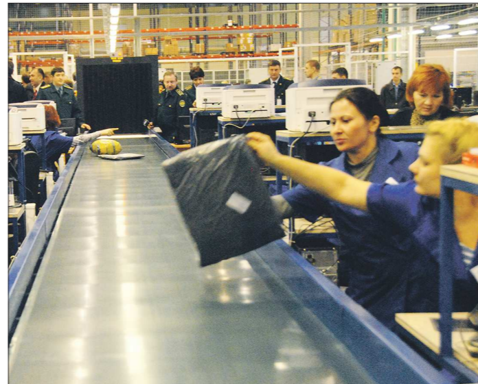
До начала 1990-х сеть Интернет находилась под полным контролем американских госорганов. В 1992 году её коммерциализация получила одобрение от Конгресса США, с этого момента электронная коммерция вступила в новую фазу своего развития

— Ускорение процесса доставки товаров почтой — это