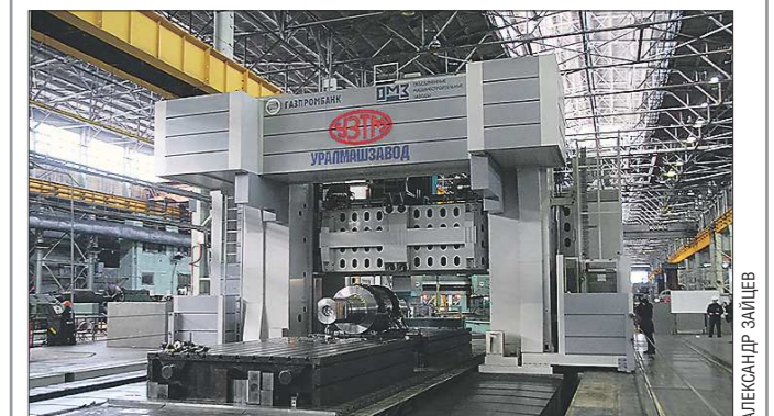
Гигант установлен в механообрабатывающем цехе Уралмашзавода