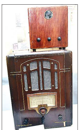
В музее сохранился один экземпляр «Б-2». Собственно телевизор — верху. Внизу — радиоприемник

80 лет назад (в 1936 году) в Свердловске начали продавать первые советские механические телевизоры марки «Б-2», изготовленные на ленинградском заводе имени Казимирского.