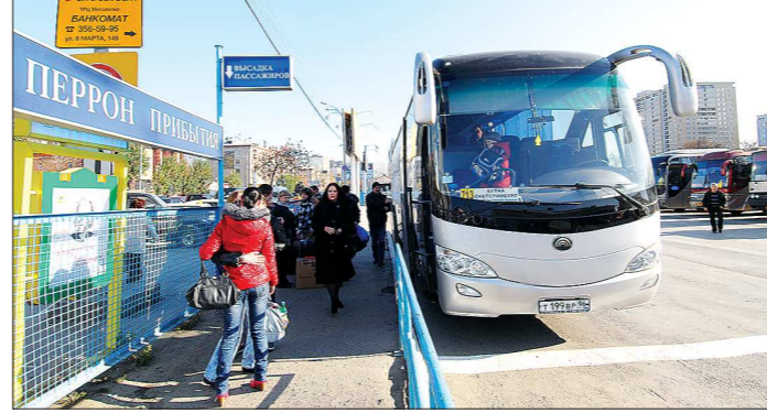
Единая транспортная сеть могла бы ускорить перемещение жителей между городами-спутниками