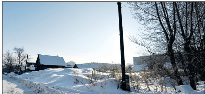
На этом месте на улице Советских Женщин, 47 стоял почти готовый трёхэтажный дом. Его руины теперь заперены снегом

В Свердловской области около 2,5 тысячи граждан пострадали от деятельности компаний, незаконно построивших многоквартирные дома на землях под индивидуальное жилищное строительство (ИЖС). Одна из пострадавших — Ирина Наножкина — дозволена на прямую линию с губернатором Евгением Куйвашевым.