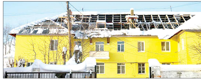
Весной снег начнёт таять, а вода уйдёт на верхние этажи

Одна из проблем, касающихся предпринимателей в целом: высокие ставки по банковским кредитам, невыгодные условия приобретения оборудования в лизинг и так далее.