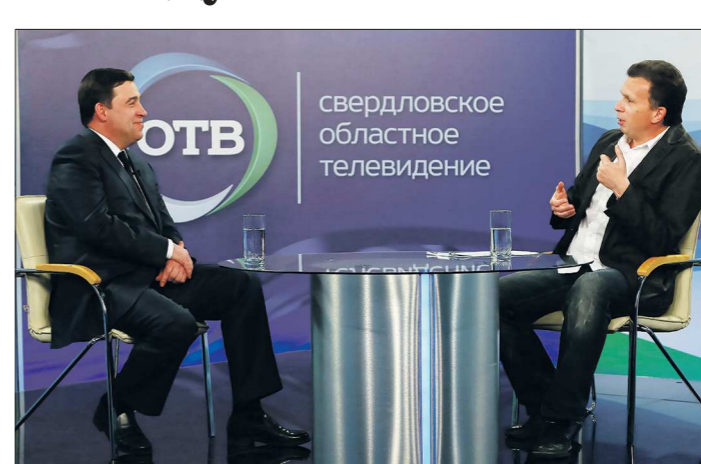
Впервые программа «Четверо против одного» вышла в эфир 14 февраля 2013 года

В пятницу, 5 февраля, на ОТВ вышел в эфир очередной выпуск ток-шоу «Четверо против одного» с участием губернатора Свердловской области Евгения КУЙВАШЕВА , в котором свердловчане задают главе региона острые, а порой и неудобные вопросы. Дискуссию вели главный редактор радиостанции «Эхо Москвы» в Екатеринбурге Максим Путинцев , ведущая программ на «Областном телевидении» Злата Малейца , директор «Телевизионного агентства Урала» (ТАУ) Инокентий Шеремет , а также режиссёр и продюсер кинокомпаний «29 февраля» Александр Федорченко .