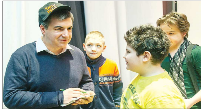
Из Нижнего Тагила Костя уехал в бейсболке с надписью «Тагил рулит!» и с расписным подносом. На прощание всем желающим раздал автографы, а молодым учёным пообещал прочитать их статьи и дать отзывы

На встречу выпускников нижегородского лицея №39 приехал профессор Манчестерского университета, лауреат Нобелевской премии по физике Константин Новосёлов.