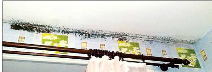
По мнению жильцов, плесень не уходит из-за холодных стен и неработающих вентиляций

Уже в 18-й программной новостройке Свердловской области появляется плесень. На этот раз проблему обнаружили верхотурские дети-сироты, которые заехали в новый дом по Заводской, 7 прошлой зимой.