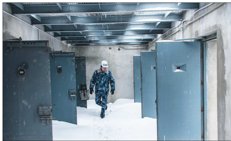
Проголочный дворик — на земле, а не на крыше, забор — без колючей проволоки. Строительство СИЗО началось в 2012 году, объём финансирования — 2,3 миллиарда рублей. После открытия здесь будут работать около 300 сотрудников