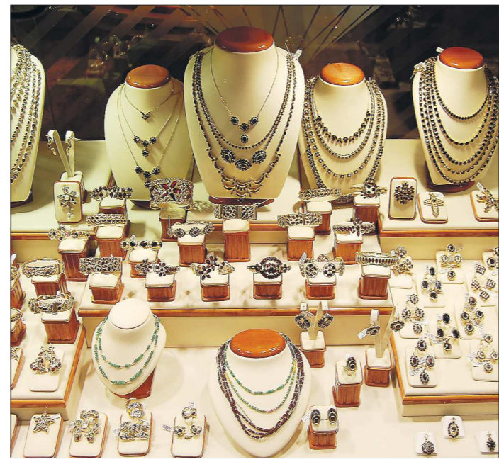
Золотые подарки требуют идентификации личности

Впрочем, покупка дороже 40 тысяч рублей тоже не норма жизни. Так, пару обручальных колец можно приобрести дешевле, чем за 30 тысяч рублей. Более того, в эту сумму укладываются и другие ювелирные украшения экономкласса: серёжки, цепочки, браслеты... Дорогие ювелирные подарки делают только по особым слу-