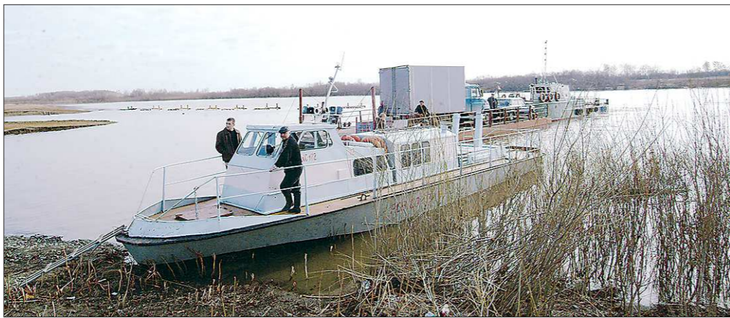
Обычно во время разлива рек в территориях используют паромные переправы, которые доставляют до соседнего берега не только людей, но и их автомобили

Администрация Гаринского ГО покупает пассажирский катер стоимостью более 10 миллионов рублей, который будет перевозить жителей отдалённых посёлков Пуксинка, Новозыково, Новый Вагиль и Шабурово. Новое транспортное средство заменит старенький теплоход «Пелым», который давно нуждается в ремонте. Готовь телегу... то есть катер, зимой, поэтому уже сейчас муниципалитеты начали ревизию водного транспорта: кто-то ремонтирует старый, кто-то покупает новый.