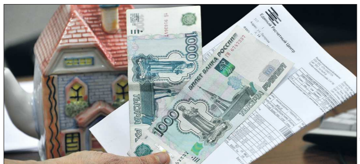
Новые нормативы могут вступить в силу уже в конце этого месяца