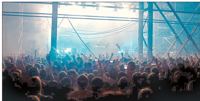
«Телеклуб» привозит в Екатеринбург мировых звёзд. На фото – концерт одного из самых популярных диджеев XXI века Tiesto

Американское издание Pollstar опубликовало рейтинг из 200 самых посещаемых клубов мира по итогам 2015 года. В первой сотне на 81-м месте расположился екатеринбургский «Телеклуб», а среди музыкальных заведений Европы он вошёл в престижный ТОП-5.