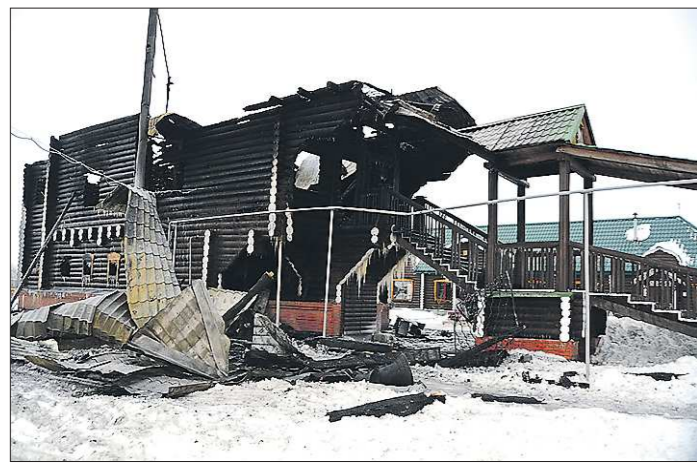
Причина пожара пока неизвестна — заключение специалистов МЧС будет готово только в течение месяца

Коммунальщикам хватало работы и в праздники