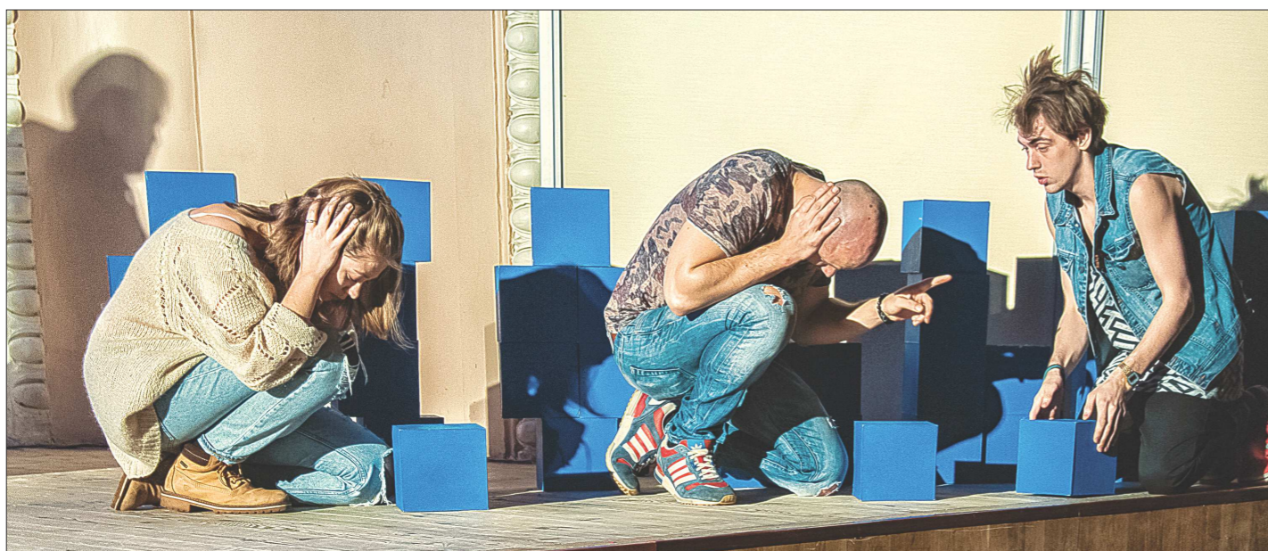
Столица Урала стала первым городом после Москвы, где показали спектакль «Особые люди». Впереди у актёров выступление в Воронеже