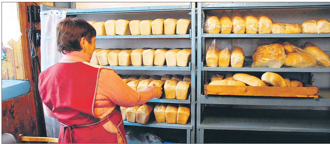
Свой хлеб люди честно заработали, но ждать зарплату вынуждены по нескольку месяцев

Работникам МУПА «Хлебокомбинат» в Лесном больше трёх месяцев задерживают зарплату. Сотрудники предприятия обратились в прокуратуру с коллективной жалобой. На момент проверки долги по зарплате за август и сентябрь 2015 года превышали 1,1 миллиона рублей. По данным «ОГ», это уже как минимум четвёртое предприятие в регионе, где с начала осени люди не могут получить заработанные деньги.