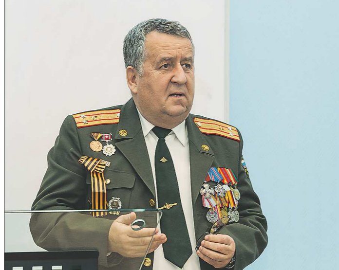
Полковник Иван Маковийчук: «Любите живых и чтите павших!»