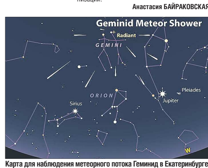
Карта для наблюдения метеорного потока Геминид в Екатеринбурге

Синоптики прогнозируют облачную погоду с прояснениями, так что уральцы имеют все шансы стать свидетелями этого события. «Самый фантастический и, вероятно, самый крупный из наблюдаемых потоков в этом году. Будет виден во всех полушариях. Сказано, что скорость потока будет такая, что наблюдателям откроется потрясающий вид независимо от метода наблюдения. Пик потока приходится на третий день после новолуния (новолуние — 11 декабря), что создаёт идеальные условия для наблюдений», — написано в календаре метеорных потоков на 2015 год от Международной метеорной организации.