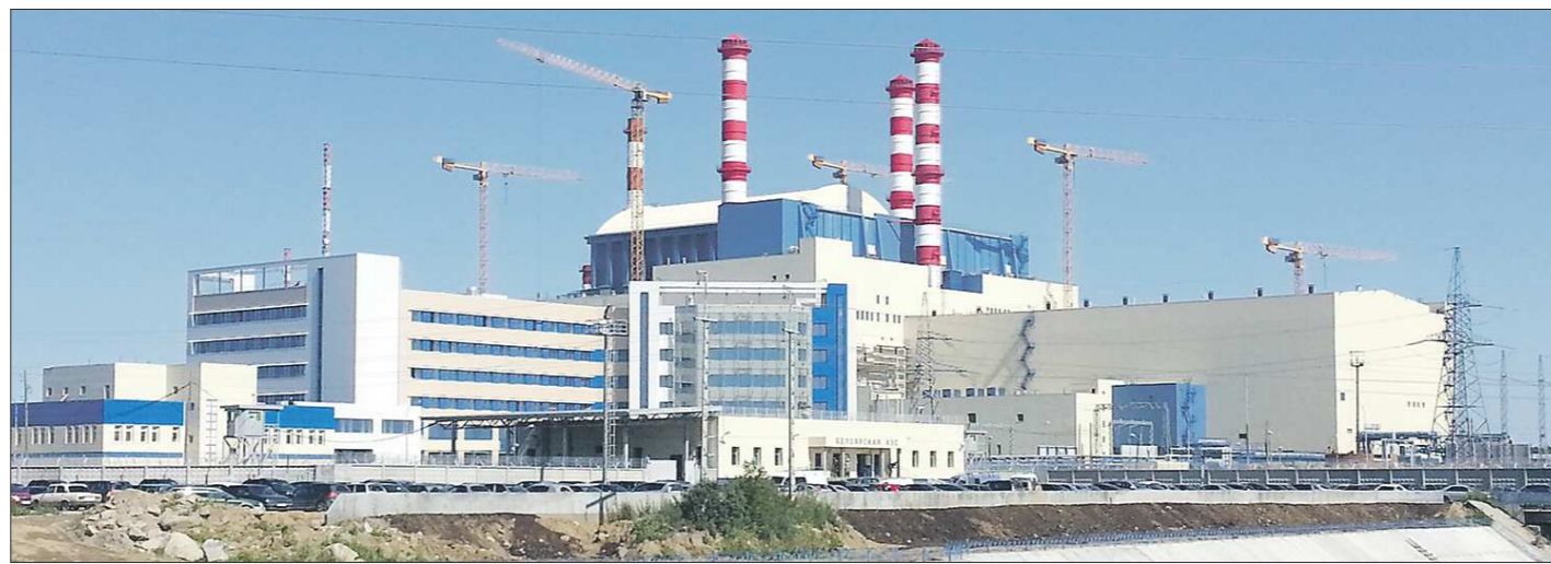
Реактор на быстрых нейтронах БН-800 должен стать прототипом более мощных коммерческих реакторов такого типа

По его словам, банкротство неизбежно, но земля и хозяйственный комплекс не будут брошены и продолжат работать.