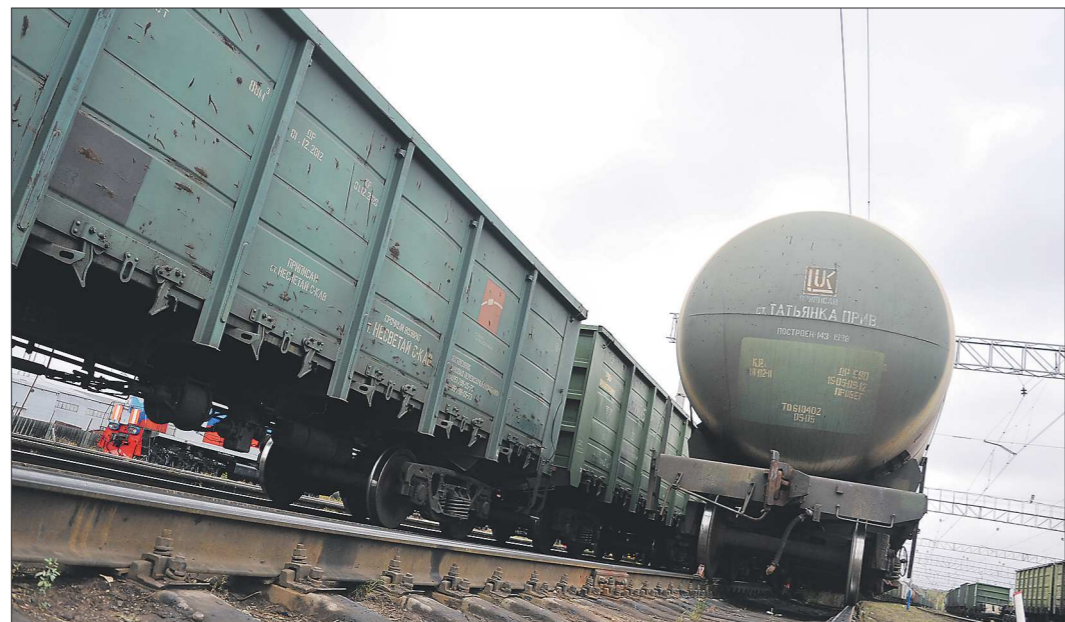
За 10 месяцев этого года в России произведено 23 тысячи грузовых вагонов