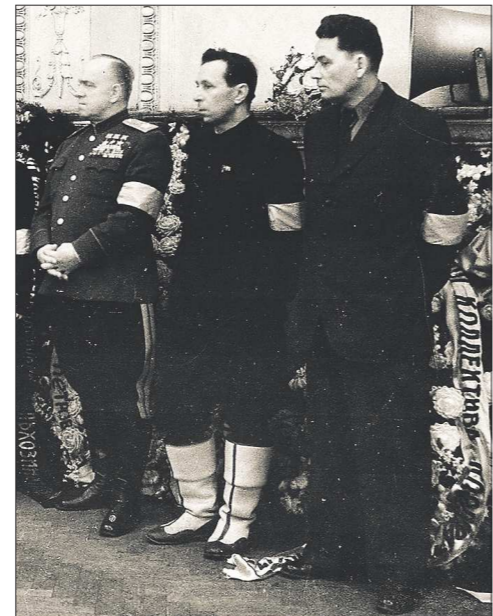
Георгий Жуков и Павел Бажов, как вспоминали их современники, были дружны, хотя познакомились незадолго до смерти последнего. На различных партконференциях и собраниях маршал и писатель обычно сидели рядом. На фото — Жуков (слева) в зале свердловской филармонии в минуты прощания с Бажовым