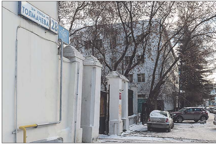
Жилых домов на Толмачёва — меньше десятка. Но от мнения жильцов зависит, сменит ли улица в очередной раз своё название