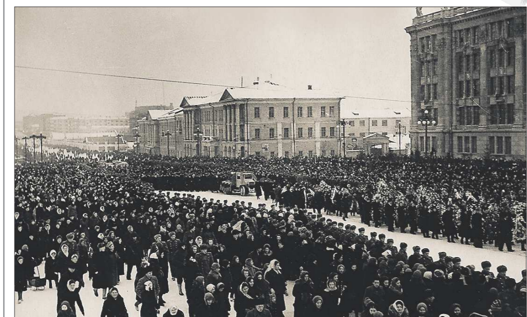
Траурную процессию сопровождали десятки тысяч людей, большинство знали Бажова по сказкам, но многие общались с писателем и лично — как с депутатом Верховного Совета СССР

65 лет назад (в 1950 году) в Свердловске состоялось похоронное писателя Павла Петровича Бажова , скончавшегося на 72-м году жизни. Проститься с автором знаменитой «Малахитовой шкатулки» вышли десятки тысяч горожан. На сегодняшний день это самые массовые и резонансные похороны в истории Свердловской области.