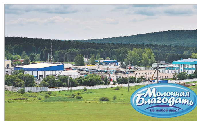
Компания «Молочная Благодать» постоянно развивается. В этом году на обновление производства было выделено более 130 миллионов рублей

Качественное сырьё — первый шаг к получению превосходных продуктов питания. Вторая не менее важная составляющая — эффективная переработка. Ведётся она на «Молочной Благодати» с применением современных технологий. Ежегодно предприятие вкладывает серьёзные инвестиции в модернизацию оборудования. Так, в этом году на обновление производства компания выделила более 130 миллионов рублей. Оборудо-