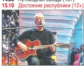
Новый выпуск шоу «Достояние республики» будет посвящен одному из самых загадочных композиторов современного шоу-бизнеса - Константину Меладзе.

06:00 События. Итоги (16+) 06:30 Д/ф «Ударная сила: Космические снайперы» (16+) 06:55 Погода (6+) 07:00 Утро ТВ (12+) 09:00 События (16+) 09:05 Д/ф «Советские машин. Еврейский трикотаж» (16+) 09:55 Погода (6+) 10:00 История генерала Гурова: Жесткий роман (16+) 10:30 Патрульный участок (16+) 10:50 События УрФО (16+) 11:20 Погода (6+) 11:25 Достояние республики (12+) 13:35 Медвежий бабостон, или Камчатка 2015 (16+) 13:55 Погода (6+) 14:00 Новости ТАУ «9 1/2» (16+) 14:55 Путеводная звезда (16+) 15:10 Достояние республики (12+)