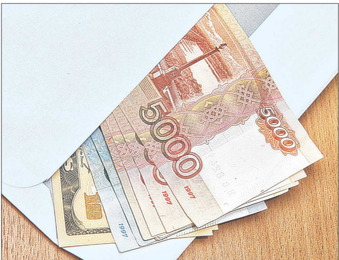
За 9 месяцев нынешнего года только следователи регионального управления Следственного комитета России по Свердловской области направили в суд 229 уголовных дел, связанных с коррупцией. В прошлом году за то же время в суд было передано 197 уголовных дел. Суммарная стоимость арестованного имущества в этом году превысила 264 миллиона рублей...