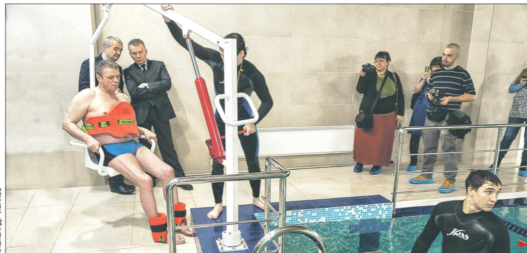
Готовится к открытию обновлённый Областной центр реабилитации инвалидов. В нём созданы все условия для возвращения людей с инвалидностью к полноценной жизни, например, работает единственный в области бассейн с аквааттракционами и специальным подъёмником

— Сегодня в лаборатории мозга нет сотрудников с ограниченными возможностями