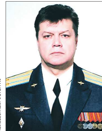
2014 год — подполковник Военно-космических сил РФ