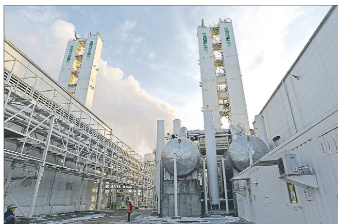
Энергоэффективность новых установок на 35 процентов выше, чем у ранее действовавшего оборудования ЕВРАЗ НТМК

Завод выдаёт 50 тысяч кубометров кислорода высокого давления в час и порядка 32 тысяч кубометров — низкого давления. Кроме то-