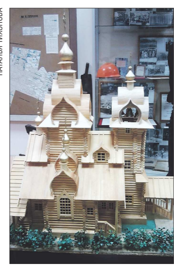
Миниатюрный храм Серафима Саровского, который недавно достроили в Бисерти

— В 70-80-е годы я ради удовольствия выжигал по дереву, потом — семья, работа — забросил это занятие, — признаётся мастер. — А тут сидел со старшим внуком и предложил: «Давай я тебе домик сделаю!» Смастерил стены и крышу — захотелось сделать целую композицию. В итоге сложил миниатюрную мебель, огородил строение заборчиком, поставил колодец, конурку и сарайчик, нашёл игрушечных зверят. Узнав об этом, сотрудники музея истории попросили увлечённого земляка собрать макет Киргизинской крепости, которая была построена в начале XVIII века по приказу Татищева для защиты от набегов. Изображения крепости нашли в Интернете, бруски и прутья для дозорных башен и церквушки мастер сделал из деревянных обрезков. — А потом загорелся новым проектом. В Бисерти на-