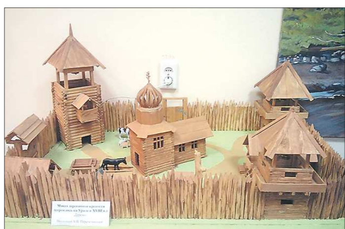
Миниатюрный храм Серафима Саровского, который недавно достроили в Бисерти