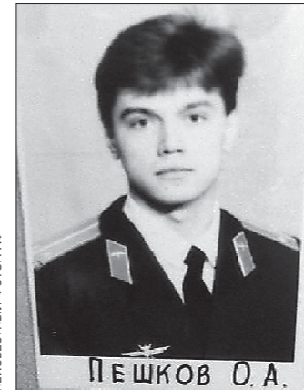
1987 год — курсант Харьковского военного авиационного училища