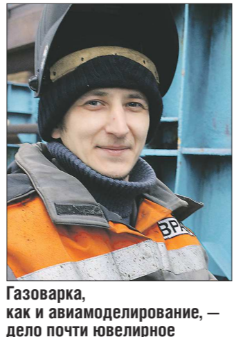
Газоварка, как и авиамоделлирование, — дело почти новелирное