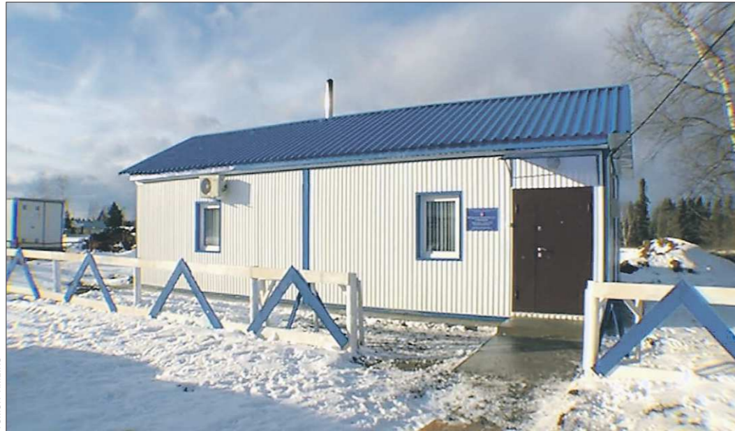
Как и ФАП нового поколения, патолого-анатомическое отделение собирается из модулей в сжатые сроки