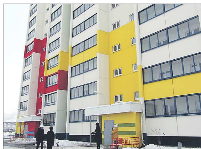
Особенностью этой новостройки на улице Октябрьской стали яркие фасады оригинального дизайна