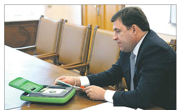
Евгений Куйвашев на встрече с кардиологами ознакомился с опытной моделью портативного сердечного дефибриллятора — совместной разработкой Уральского оптико-механического завода и Уральского института кардиологии

В администрации уверены, что на квартиры будет неплохой спрос. Заявки на участие в программе продолжают поступать, но желающих придётся подождать, пока будет построена вторая очередь программного жилья: всего до конца 2017 года в городе планируют построить около 570 квартир. Кроме Каменска-Уральского, жильё экономкласса пойдётся ещё в 11 муниципалитетах — Верхней Салде, Дегтярске, Первоуральске, Нижнем Тагиле, Нижней Туре, Свердловске, Берёзовском, Полевском, селе Кашино (Сысертский ГО), Талице и Серове.