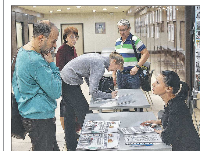
Подписать на социальную версию «Областной газеты» накануне смогли врачи и пациенты Областной клинической больницы №1. Для них в лечебном учреждении был организован специальный подписной пункт. За несколько часов удалось собрать около 350 заявлений. Среди подписавшихся – не только жители Екатеринбурга, но и других городов и населённых пунктов Свердловской области. Ещё один «День подписчика» здесь состоится 12 ноября