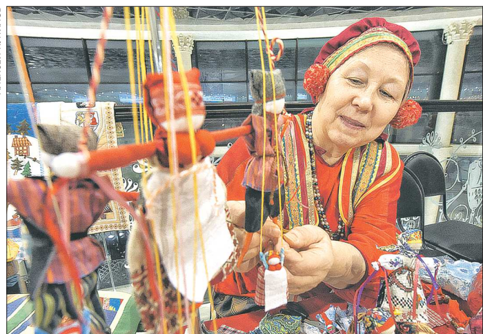
В рамках «Дмитриева дня» в ТЦ «Гринвич» прошла выставочная ярмарка изделий народного промысла и показ русских народных костюмов. Чего только там не было – валенки, расписные, куклы, звонкие глиняные горшки, кухонная утварь, тески из бересты, всякие забавные безделушки