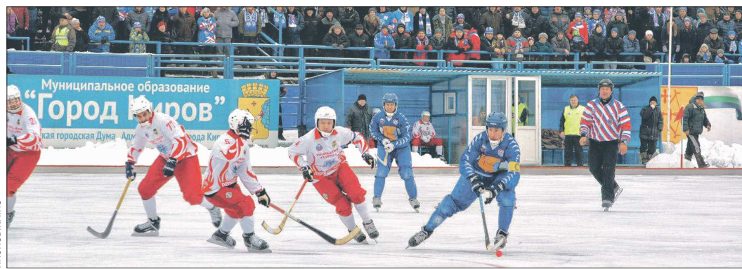
МУНИЦИПАЛЬНОЕ ОБРАЗОВАНИЕ ГОРОД ИРКУТСК

За оставшиеся три путёвки предстоит нешуточная борьба среди большой группы команд, в которую входит и «Ураль-