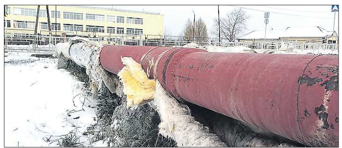
В школе №1 отопление включили, но теплосети так и оставили без изоляции

Напомним, что депутаты Белоярской думы предлагали ввести в муниципалитете режим ЧС, когда с 27 октября без тепла оставались дома на улицах Ключевской, Милейской, Ленина, Юбилейной. Местные власти обещали решить проблему в течение недели, но в срок не уложились, поэтому пришлось вмешаться областному правительству. Кстати, в 2014 году округу выделили 210 миллионов рублей из областного бюджета на модернизацию системы теплоснабжения. Поскольку результатом вложения денег стал срыв отопительного сезона, следовательно завели уголовное дело по факту халатности в действиях сотрудников муниципальной котельной при обеспечении теплоснабжением потребителей Белоярского ГО.