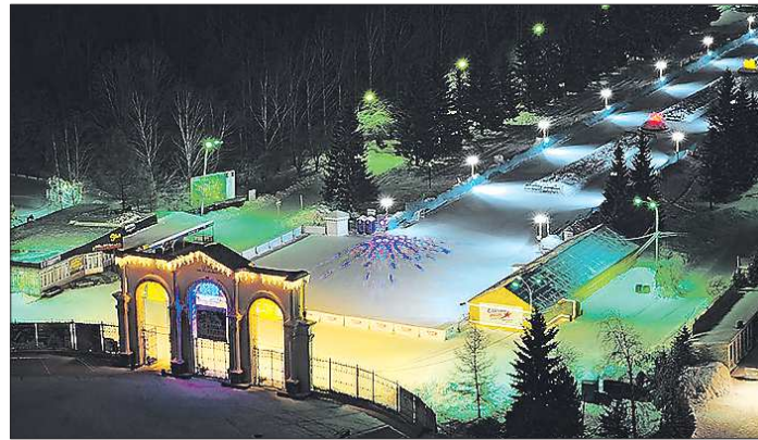
Сейчас у парка нет единой концепции. Новый директор планирует начать работу над её созданием