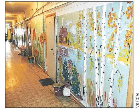
Художники разрисовывали здание вместе с местными жителями — они с энтузиазмом взялись преображать стены родного дома