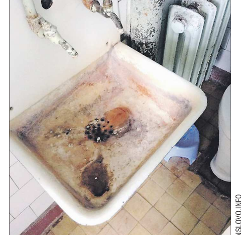
По словам молодой мамы, состояние медицинского учреждения в Североуральске непригодно для нахождения там с детьми

Североуральцы жалуются на состояние центральной городской больницы, передаёт «Наше слово в каждый дом». Одна из пациенток Екатерина Заблицкая попала в инфекционный отделение больницы с 9-месячным сыном, но после увиденного перевелась в Краснотурьинск.