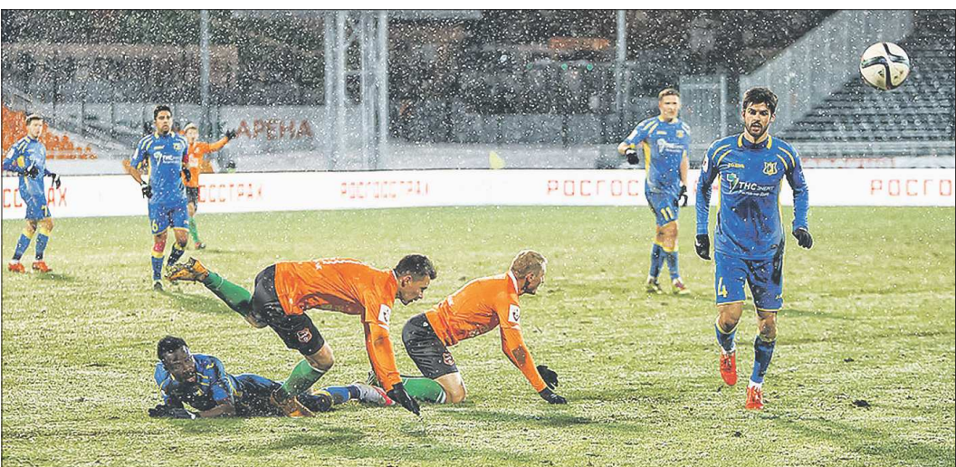
В заключительной встрече первого круга екатеринбуржцы споткнулись на команде с Дона

В турнирной иерархии ростовчане явно превзошли екатеринбуржцев. Второе место – не чета восьмой позиции, тут уж ничего не попишешь. И всё же успех нашей команды, если абстрагироваться от строчек в таблице, можно поставить чуть выше промежуточного результата южан. Они и раньше временами будоражили футбольную общественность – достаточно вспомнить неожиданное завоевание пару сезонов назад Кубка России. «Шмели» в турнирных подвигах до сей поры никем замечены не были. «ОГ» попыталась разобраться, что же нынче так вдохновило уральцев. Мы пролиста-