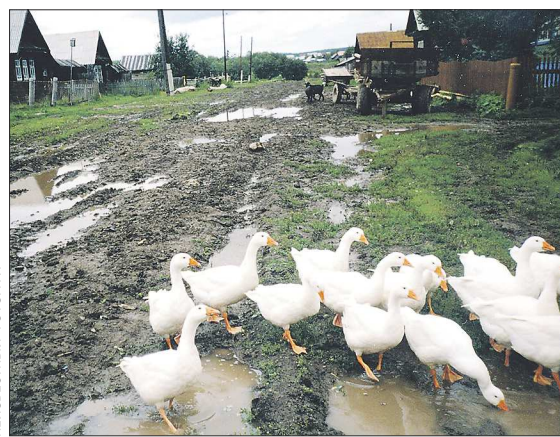
«На улице Пролетарской и зимой, и летом одно и то же», — пишут жители деревни Васкино. Судя по всему, доволны только гуси

«По улицам нашей деревни кроме как в болотных сапогах пройти невозможно, самые проблемные у нас — Пролетарская, Советская и Набережная. Иной раз приходится вытаскивать сапоги из этих луж и жить с одной только мыслью — хоть бы не утратить! Когда у нас проходил Курбан-байрам, все в чистой нарядной одежде вышли, а вернулись домой по пояс грязными. Отдельного внима-