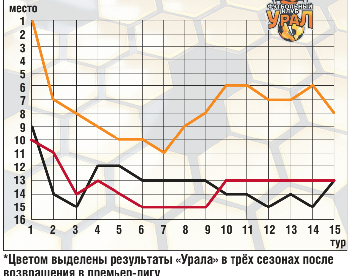
График движения «Урала» по турниру 2013/2014, 2014/2015 и 2015/2016*

Президент клуба всегда противился формулировке турнирной задачи в цифровом выражении. «Победа в каждой игре», – говорил он обычно. В предыдущем чемпионате перед командой стояла задача – занять место не ниже десятого, поскольку в дебютном сезоне она уже была 11-й. Середина оказалась недостижимой, но уральцы хотя бы остались в премьер-лиге... В одной из октябрьских публикаций мы уже задавались вопросом: какую задачу нашей команде решать теперь – с учётом её нынешней позиции? От зоны вылета екатеринбуржцев отделяют десять очков, от стыковых матчей – девять. При таких раскладах ориентироваться только на сохранение прописки в премьер-лиге как-то не к лицу. А вот до зоны еврокубков – рукой подать. И это гораздо более интересная и стратегически перспективная задача на второй круг чемпионата.