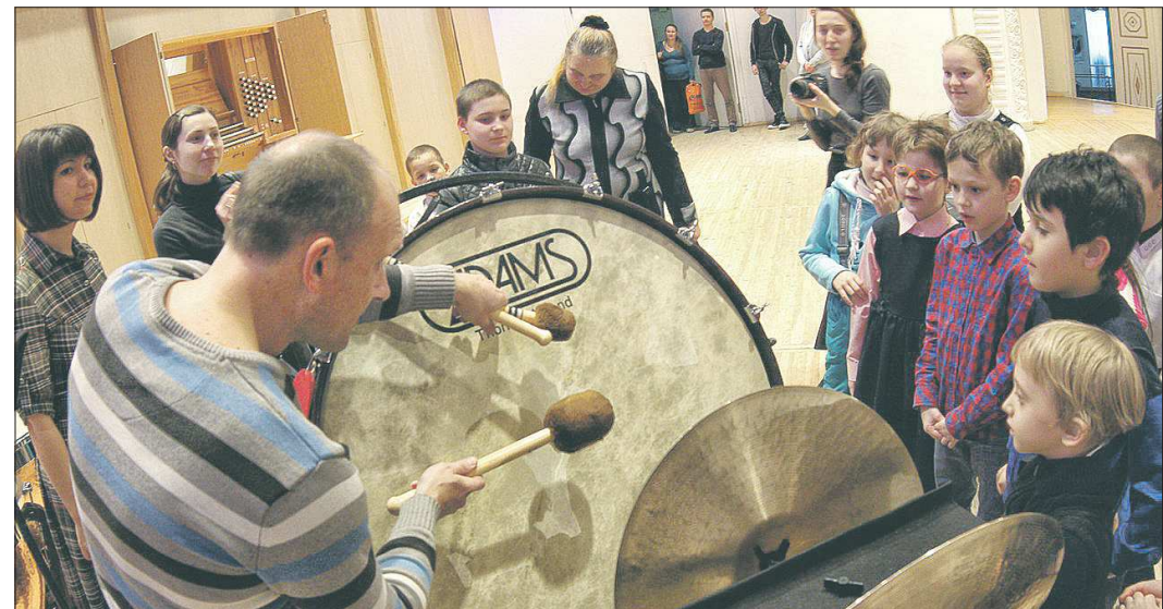
Вчера музыканты Свердловской филармонии познакомили первоклассников и второклассников с музыкальными инструментами

Прежде музыкальным воспитанием глухих и слабослышащих школьников не занимался никто: считалось важным обеспечить их элементарное общение и образование. Разумеется, без знания о красоте музыки большая и важная часть жизни таких детей была невосполнимо потеряна. Интерактивный проект РИТМ (реабилитация, инклюзия, творчество, музыка) филармонии и Центра «Эхо» позволил восполнить этот пробел в воспитании. Во-первых,