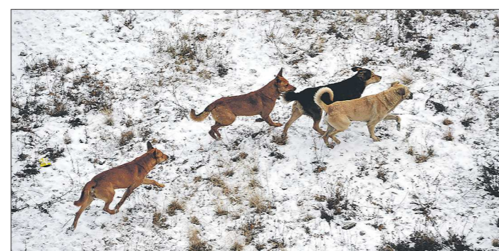
Обычно опасны бездомные собаки, сбившиеся в стаю. В холодное время они очень агрессивны

За отлов собак отвечают муниципалитеты. Администрация каждого из них решает, какое учреждение будет ловить бездомных животных: можно заключить контракт с уже существующей специализированной организацией или создать новую, можно возложить ответственность на профильный комитет. Одно точно — этим делом должны заниматься специально обученные люди. Усыплять необходимо только тех собак, которые проявляют беспричинную агрессию к людям и не поддаются социальной адаптации, а также неизлечимо больных. Согласно Гражданскому кодексу РФ, делать это можно в том случае, если в течение полутора не объявится хозяин псыны, однако, как призналась заместитель директора Департамента ветеринарии Свердловской