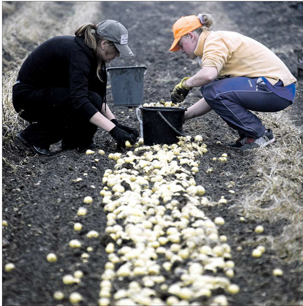
Самый крупный студенческий уборочный отряд работал в ЗАО АПК «Белореченский» — до 500-600 человек за сезон. Туда приезжали студенты УГТУ-УПИ, последние пять лет хозяйство обходилось без них