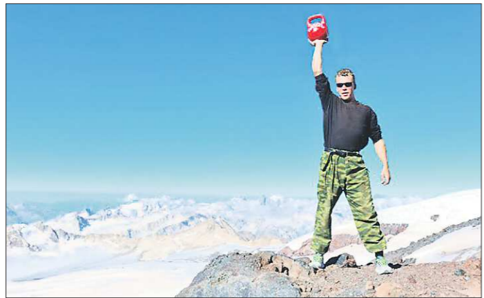
Нести гирию назад серовчанин не решился — оставил в горах

дедушка из Ханты-Мансийского округа, скоро ждёт ещё одного такого гостя. Важная часть производственного процесса — это баня. Здесь в баке для горячей воды запариваются ивовые прутья, после чего кора с них снимается легко, а сами они становятся податливыми.