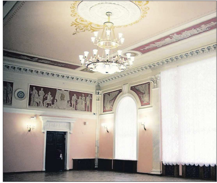
Внутреннему убранству театра вернули исторический облик. На реконструкцию было выделено порядка 40 миллионов рублей из областного бюджета

Новый театральный сезон нижнетагильская драма начинает в капитально отремонтированном здании. Здесь установлены современные инженерные сети и сценическое оборудование.