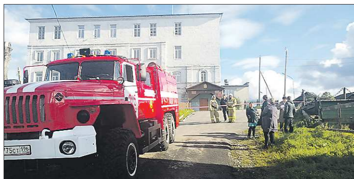
Администрацию на несколько часов оцепили бригады полицейских и пожарных

В стратегии описаны и другие проблемы, с которыми сегодня сталкивается отрасль. Это утрата некоторых промыслов — традиционные технологии забыты, нет умельцев, которые могли бы их возродить. По словам уральских мастеров, это актуально и для нашего региона. Единственное заведение области, где учат художественной росписи подносов — Уральский колледж прикладного искусства и дизайна. В этом году на это направление набрали всего 11 человек. Но даже для них вопрос трудоустройства может оказаться большим. Найти работу по специальности почти невозможно. Единственный вариант — становиться индивидуальным предпринимателем и работать по заказам. Главное, чтобы они были.