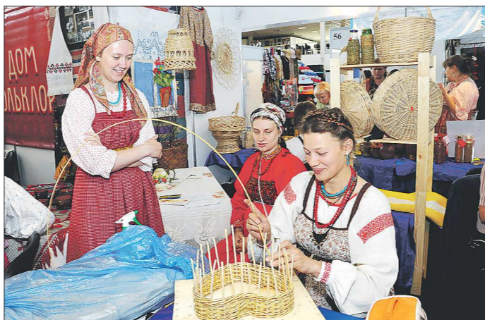
Сбыть продукцию народного творчества помогают выставки и ярмарки. Но, к сожалению, они не так часты, как хотелось бы самим ульмам

— 15 июля 2013 года принят закон «О народных промыслах в Свердловской области», там прописаны основные направления работы. Но комплексных мер поддержки нет, пока это лишь единичные мероприятия. Фонд поддержки малого и среднего бизнеса в прошлом году проводил семинар для предпринимателей, которые занимаются народными промыслами. Мы вывели мастеров в Москву на выставку художественных промыслов «Ладья», площади им