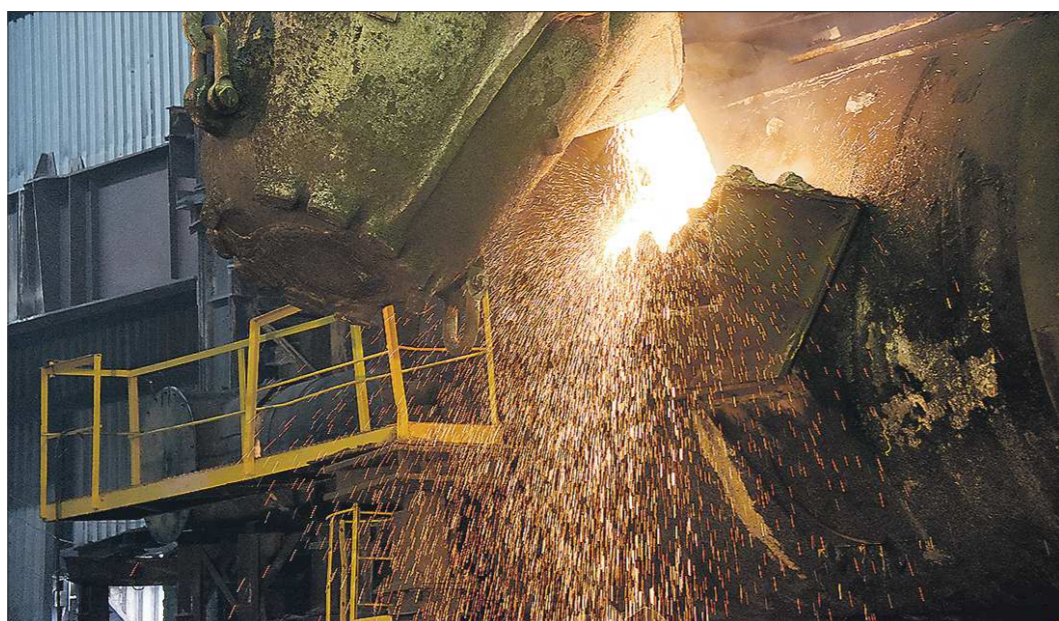
Ревдинский кирпичный завод в 2016 году должен запустить новый цех, завод ОЦМ планирует рост объёма производства в пять раз, а СУМЗ до 2018 года продолжит программу перспективного развития

Ревда, наряду с Верх-Нейвинском и Кировградом, попала в тройку муниципалитетов, чьи программы комплексного развития до 2020 года были утверждены правительством Свердловской области в конце июля 2015 года. Отличается эта программа преимущественно финансовыми объёмами: в ближайший пять лет на улучшение жизни городского округа будет потрачено 29 миллиардов 727,7 миллиона рублей. Рекордная сумма сложится из бюджетов Ревды, региона и вложений иных источников, например, УГМК.