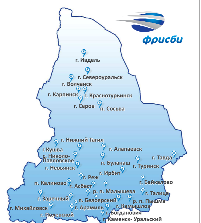
«Фрисби» — приём платежей «с человеческим лицом»

ООО «ЕРЦ» — Финансовая логистика надеется, что многолетний опыт работы в сфере приёма платежей позитивно отразится на развитии системы в Свердловской области и её жители по достоинству оценят новые возможности и преимущества партнёрства. Например, абоненты уже сейчас могут оплачивать услуги онлайн с помощью любой банковской карты на сайте «Фрисби» ( www.frisbee-pay.ru ).