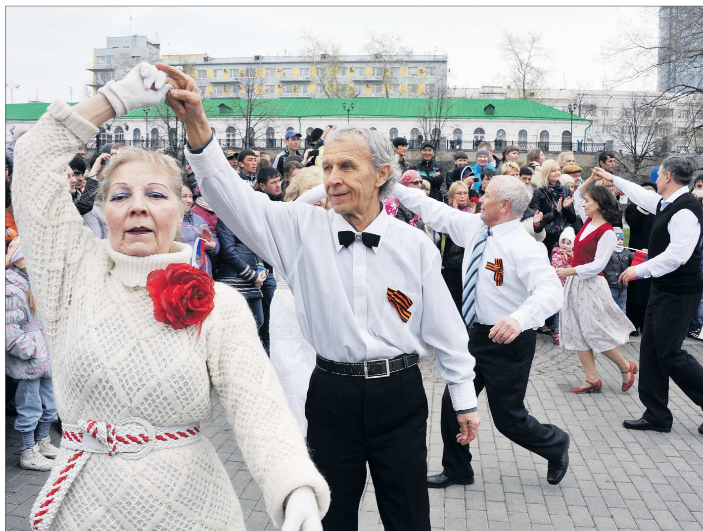
На мероприятиях, посвящённых Дню пенсионера, виновники торжества могут не только посмотреть чужие концертные выступления, но и сами потанцевать-попеть