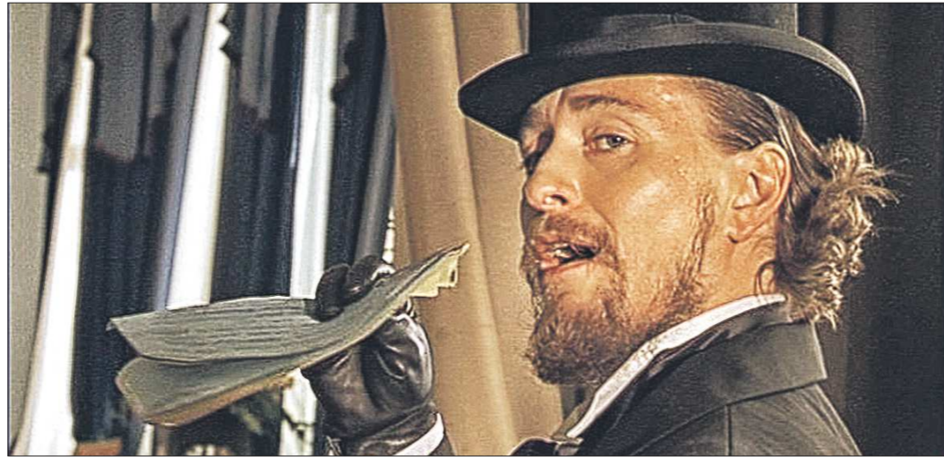
Фильм «Золото» – один из последних проектов Свердловской киностудии

– Я пока никакого оптимизма по поводу этой новости не чувствую. Думаю, что такое мероприятие, как Год российского кино, должно было бы выразиться в первую очередь в финансировании государством кинопроизводства, причём истинно российских фильмов, а не тех, которые повторяют шаблоны голливудских картин. Попробуем вспомнить о великой советской кинематографии... Кроме того, боюсь, что в пункте о «модернизации ведущих киностудий страны» как раз о Свердловской киностудии речи не идёт. Просто из года в год объём производства провинциальных киностудий сокращается в пользу Москвы. А если кинематография будет развиваться только в Москве и немножко в Петербурге, то я не думаю, что это будет способствовать оживлению или возрождению российской кинематографии в целом. Российское кино без провинции просто не может существовать и развиваться. А сейчас даже то ничтожное, по сравнению с прошлым, количество картин, которое мы делаем, никакого отношения к Свердловской киностудии, увы, не имеет. Что касается проката, то в настоящее время в соответствии с действующим законодательством, к сожалению, ничего исправить нельзя. А значит, наша молодёжь будет смотреть американское кино, притом второсортное – не содержательное, а аттракционную развлекаловку.