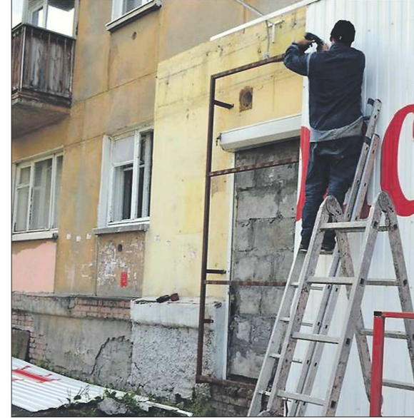
За последнюю неделю специалисты агентства ликвидировали около 30 рекламных щитов