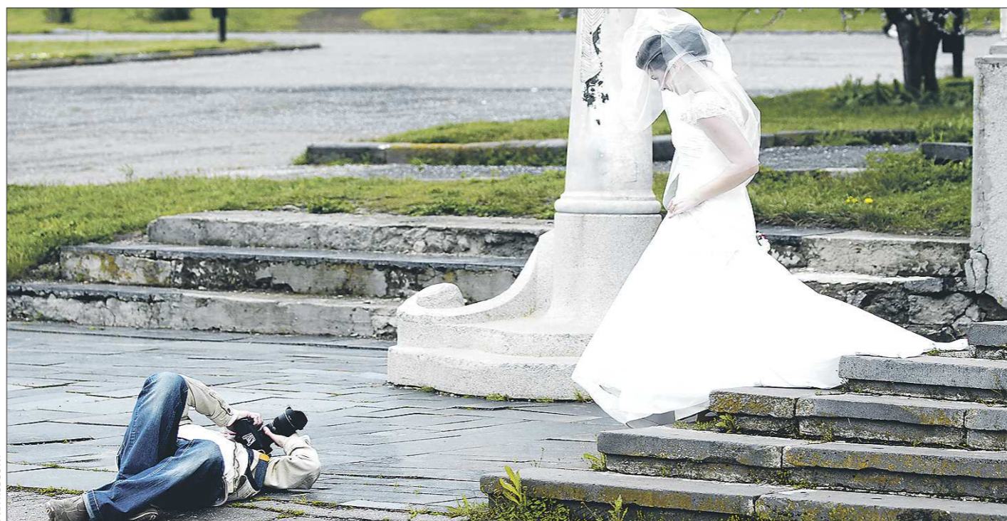
Свадебные фотографии в числе других профессиональных считаются «самозанятыми». Теперь они смогут легко и быстро легализовать свои доходы

КСТАТИ. Банкротство фабрики не означает, что она остановилась. Фабрика работает, объёмы производства в течение двух последних лет здесь остаются стабильными. Будет ли производство закрыто, перепрофилировано или продано с молотка — зависит от того, какую политику выберет конкурсный управляющий.