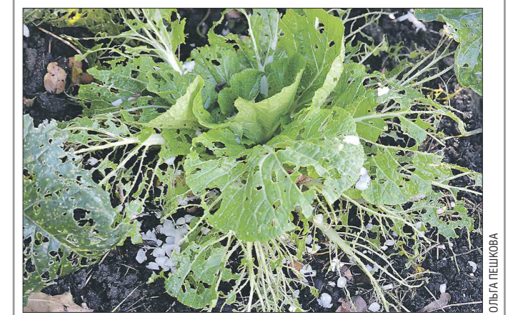
Средний Урал переживает нашествие слизней и капустной моли. От вредителей уже пострадали многие огородные растения. Специалисты Россельхозцентра объясняют: рост популяции слизней связан с благоприятной для этих бронхоногих моллюсков погодой, а у капустной моли в этом году наступил период массового размножения