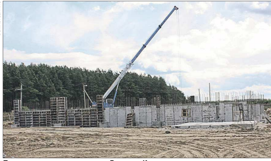
Так сегодня выглядит детсад в Большом Истоке – его должны запустить до конца текущего года

чал принимать деток только в конце апреля, и то на неполный день. И лишь в мае заработал в нормальном режиме. Так с момента официального открытия до реального начала работы прошло четыре с лишним месяца.