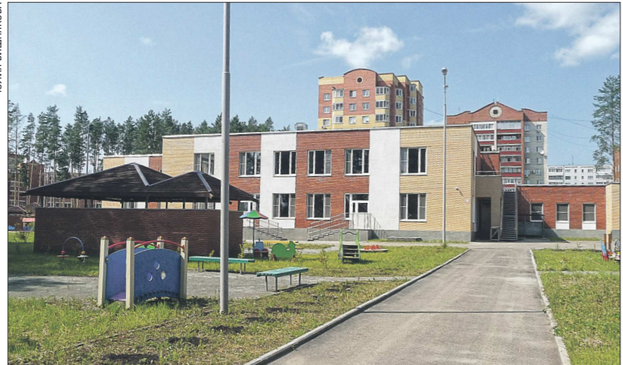
Этот садик в Заречном достроили в ноябре прошлого года, но он до сих пор пустует

Гораздо дольше пришлось ждать деткам, получившим путёвки в екатеринбургский детский сад №128. Его торжественно открыли в декабре 2013 года, но малышек не приняли. В феврале 2014 года возмущённые родители с путёвками на руках стали звонить заведующей, и каждый раз их уверяли, что вот-вот детей начнут принимать. Но день «икс» всё откладывался: то трубы с горячей водой прорвет, то у СЭС вопросы возникнут... В итоге садик на-