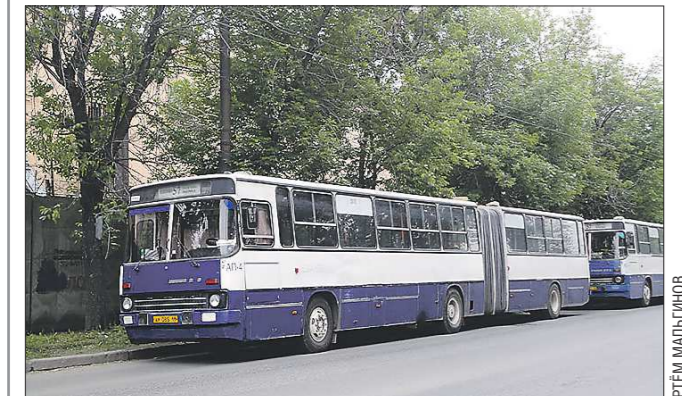
На муниципальном автобусном предприятии каждый девяностый водитель — дама