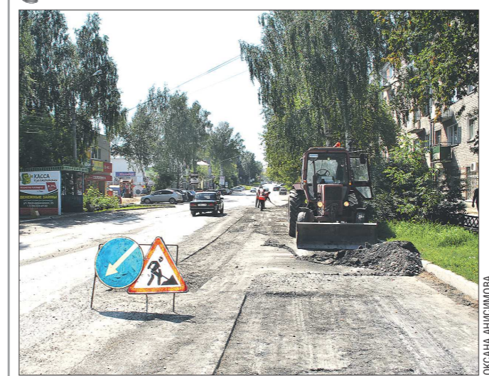
После публикации «ОГ» от 28 июля 2015 года (статья «Конфликт в думе Реже сделал её недееспособной»), где мы, помимо прочего, рассказали о закрытии для движения общественного транспорта центральной магистрали Реже, в городе наконец-то начался ремонт асфальтового покрытия. Есть надежда, что скоро улица Ленина станет пригодной для проезда