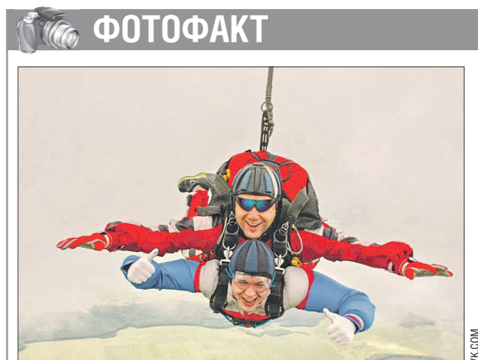
На аэродроме Логиново вблизи Екатеринбурга в минувшие выходные прошёл фестиваль в честь 85-летия парашютного спорта.