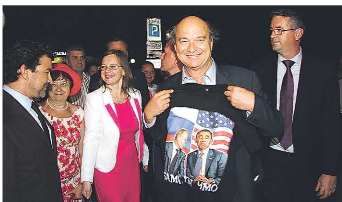
Сенатор Ив Поццо ди Борго купил в Крыму футболку с некорректной надписью о президенте США

Сам факт поездки вызвал отрицательную реакцию многих ведущих европолитиков. В Версальском дворце, по утверждению прессы, этот визит вызвал настоящие «шок и панику». Ведь побывавшие на полуострове депутаты теперь не просто будут рассказывать о настроениях крымчан, но и выступать в роли экспертов — очевидцев, к которым будут вынуждены прислушиваться и политики, и дипломаты. Ссылаться на «пропутинскую пропаганду» им теперь будет гораздо труднее. «Не верите нам — поезжайте и убедитесь сами, поговорите с людьми, пообщайтесь с ними», — скажет своим оппонентам любой из побывавших