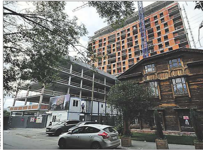
В центре Екатеринбурга элитное жильё соседствует с бараками