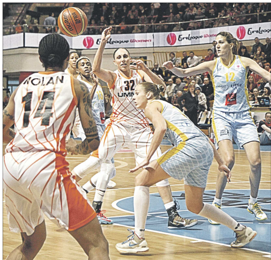
В 2004 году «УГМК» лишили участия в Евролиге за махинации с паспортами американок. На этот раз это может случиться из-за разборок вокруг РФБ

Два года практически непрерывных судебных разборок закончились тем, что Московский городской суд объял баскетбольную обществу прокатиться на машине времени — провести заседание исполкома РФБ образца 2010 года и назначить новые выборы президента федерации. Есть даже претендент №1 на этот пост — самый знаменитый российский баскетболист современности Андрей Кириленко, который как раз очень кстати завершил карьеру и готов сменить трусы и майку на офисный костюм.