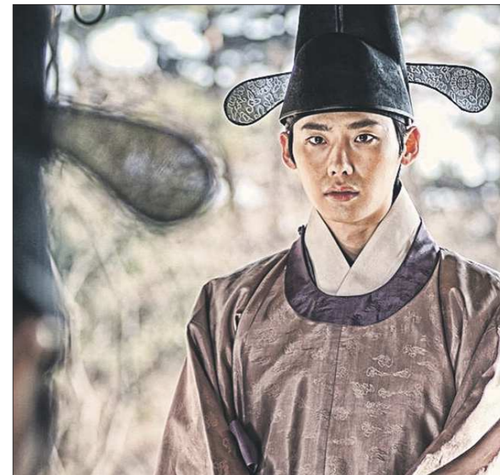
«Читающий лица». 2013 год. Действие картины разворачивается в 1455 году — в период захвата трона Сеждо Чосоном. Нае-Кюн — сын главы одной из пострадавших семей — изучает физиогномику. Он может оценить психическое состояние и привычки человека, глядя на его лицо. Из-за своей способности он оказывается втянутым в борьбу за власть

Кстати, за три недели Фестиваль корейского кино объедет почти всю Россию. Наталья ШАДРИНА