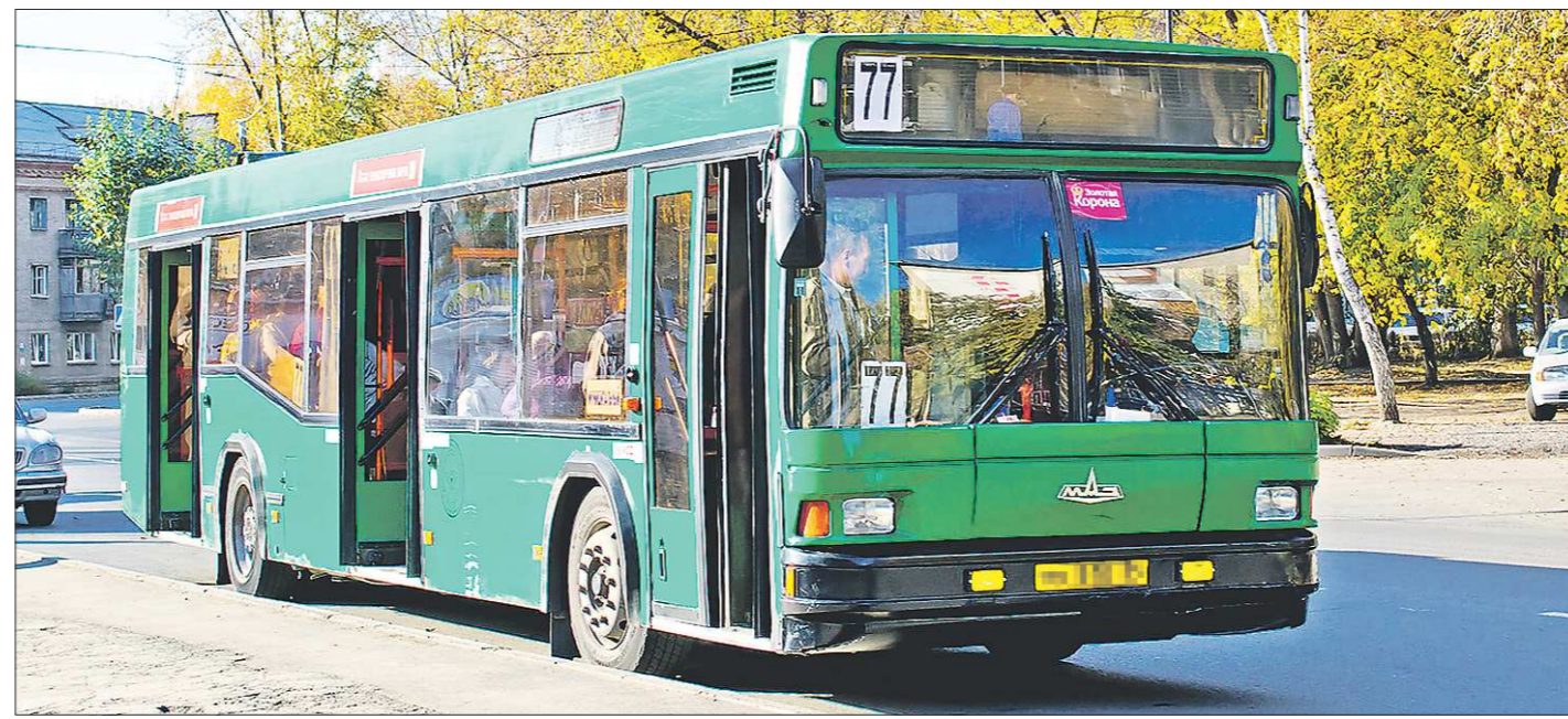
Когда администрация Екатеринбурга решила, что у автобусов должен быть один цвет, большинство горожан выбрало зелёный

— Нам важно, чтобы система работала как часы. Я дал указание ввести в состав конкурсных комиссий депутатов Заксобрания, представителей муниципалитетов, областного министерства энергетики и ЖКХ. Это нужно, чтобы процедура отбора подрядчиков стала максимально понятной и прозрачной для всех, — рассказал о принятых решениях Денис Паслер. — Плюс к тому мы намерены добиться, чтобы в процессе приёмки отремонтированных домов активно участвовали представители жильцов этого здания и общественного контроля. Это важно для того, чтобы в будущем было как можно меньше нареканий к качеству ремонта.