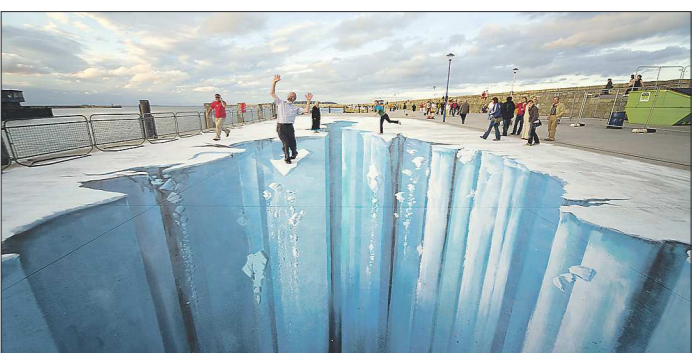
3D-граффити. Один из самых известных художников, работающих в этой технике, — немец Эдгар Моллер. Свои картины он рисует на асфальте и рассчитывает пространство так, что если встать в определённой точке, то рисунок будет казаться объёмным. Например, нарисованная в такой технике пропасть с некоторых углов будет выглядеть абсолютно реальной