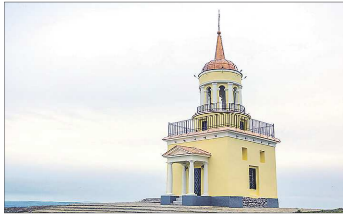
За основу проекта башни были взяты чертежи, хранящиеся в музейных фондах