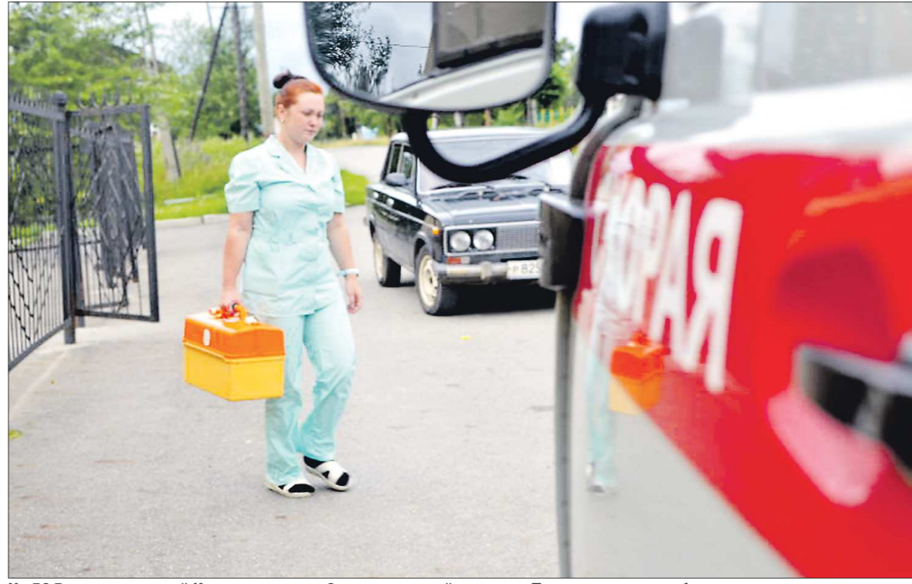
На 58,5 тысячи жителей Красноуральска 8 машин «скорой помощи». Теперь одна из них будет выезжать ещё и в посёлок Рудничный

В красноуральской больнице призывают не нервничать, так как обычно бригада из города доезжает до Рудничного в течение 15 минут. По нормативам, на дорогу до больного у врачей скорой помощи должно уходить не более 20 минут, так что стандарты доступности соблюдены. Да и статистика вызовов в Рудничном невелика — в среднем в день бывает до четырёх вызовов. Всего же в Красноуральске работают восемь машин «скорой помощи», они обслуживают более 58,5 тысячи жителей. Несмотря на то, что с точки зрения стандартов здравоохранения Рудничный должен обходиться без собственной скорой помощи, население посёлка категорически против.