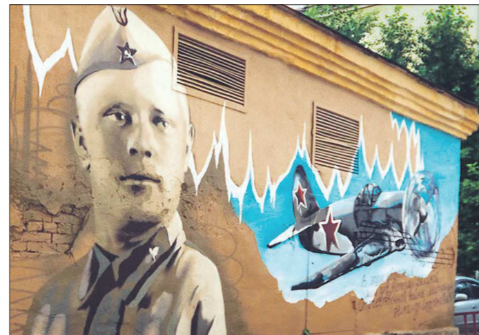
Портрет деда-ветерана, ул. Малышева, 15. Автор: команда «MES Crew» под руководством Игоря Митюнина из Екатеринбурга. Год создания — 2015