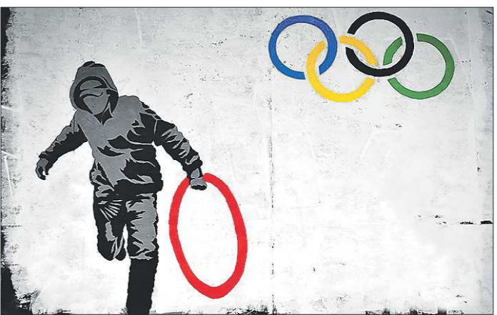
Рисунки Бэнкси (Banksy). Социальные граффити этого англичанина знамениты во всём мире. Его имя и лицо никому не известны, а работы выставляются в музеях и продаются на аукционах. Коллекционеры готовы платить за его рисунки баснословные деньги, одна из работ ушла с молотка за полтора миллиона долларов