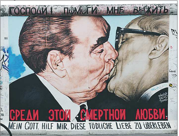
«Поцелуй Брежнева и Хонеккера». Исторический момент изобразил в 1990 году художник Дмитрий Врубель на уцелевшей после падения части Берлинской стены. В 2009 году в рамках реставрации стены рисунок стёрли. Но позже власти всё же разрешили его восстановить, увидеть его в Берлине можно и сегодня