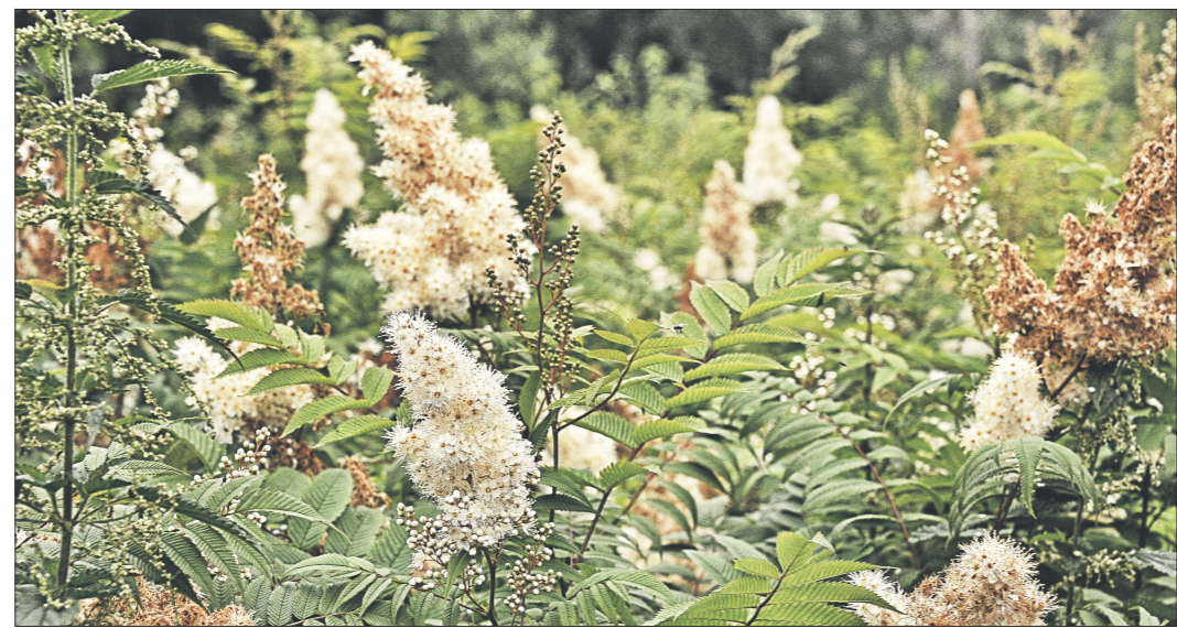
Кусты спиреи морозоустойчивы и хорошо приспособлены к городским условиям, а главное — всё лето радуют глаз пышными соцветиями

По её словам, в 1956–1957 годах в парке Коммунаров было высажено около одной тысячи 400 деревьев. Однако долгие годы ухаживать за ними было некому, поэто-