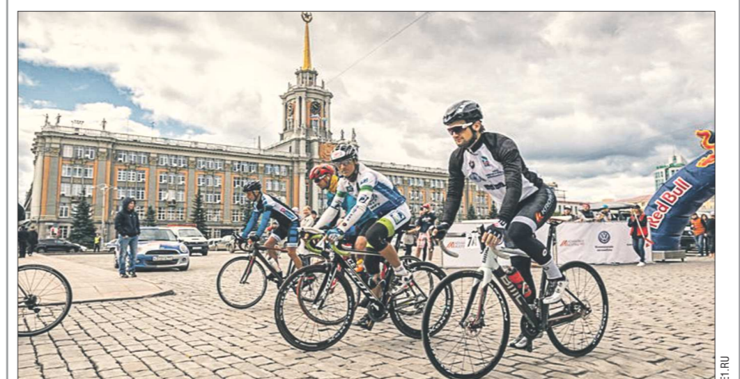
Екатеринбург принял участников самой протяжённой в мире велогонки Red Bull Trans-Siberian Extreme. Спортсмены стартовали с Театральной площади в Москве 15 июля и должны добраться до Владивостока к 6 августа. Всего велогонщикам предстоит преодолеть 15 этапов. Общая протяжённость пути, который предстоит пройти участникам, составляет более 9,2 тысячи км. До Екатеринбурга спортсмены уже останавливались в Костроме и Перми. Впереди у них Тюмень, Омск, Новосибирск и Красноярск. Велогонщики продолжают ехать без остановок, сменяя друг друга. Всего в гонке принимают участие 10 профессиональных велосипедистов. Среди них россияне, австрийцы, бельгийцы, британцы, немцы и итальянцы. Четверо из них едут в одиночку, а шесть спортсменов разделены на команды по два человека. Россия на гонке представляют олимпийский чемпион 2004 года и бронзовый призёр Олимпиады в Пекине на треке Михаил Игнатьев и чемпион мира 2014 года Иван Ковалёв – они едут в паре. Ещё один россиянин Денис Маджара выступает в категории «соло»