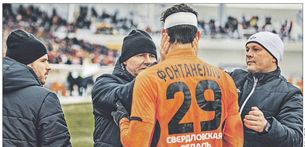
На игровой форме фамилия «шмеля» написана не совсем правильно...