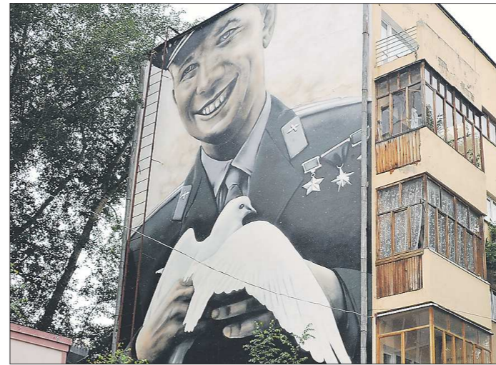
Портрет Юрия Гагарина, ул. Малышева, 21/4. Автор: Андрей Пальваль из Харькова. Год создания — 2014