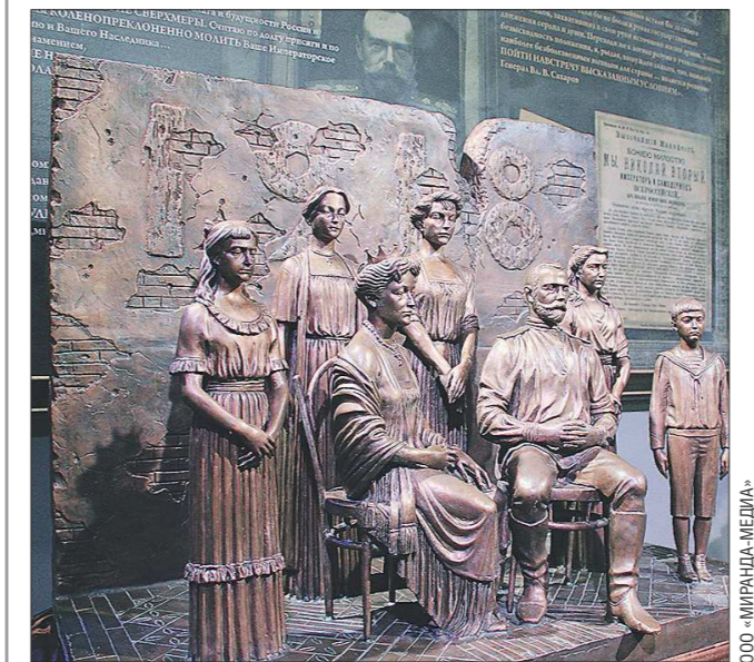
В скульптуре «Ипатьевская ночь» фигуры всех членов семьи Николая II расположены именно так, как стояли за секунду до расстрела

День памяти династии Романовых прошёл и в Крыму, в Ливадииском дворце. Здесь Свердловский краеведческий музей организовал выставку «Ипатьевская ночь», продемонстрировав оригинальную композицию скульптора Зураба Церетели и архитектурный макет Ипатьевского дома от 1918 года, а также представил мультимедиа-реконструкцию здания на момент прибытия туда царской семьи. Перед посетителями Ливадииского дворца выступил камерный оркестр Уральского музыкального колледжа. Коллектив исполнил неизвестные до сегодняшнего дня музыкальные произведения, написанные императором Александром II, великой княгиней Александрой Иосифовной и великим князем Константином Константиновичем. По словам вице-спикера Законодательного собрания Свердловской области Елены Чечуновой, проект был реализован в рамках подписанного год назад соглашения о сотрудничестве в сфере культуры между Свердловской областью и Республикой Крым.