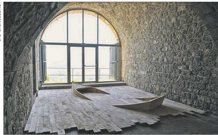
Одна из работ Стефана Тиде – скульптура «Наводнения», 2010 год. Коллекция национального Центра пластических искусств, Франция

Кстати, на родине у него остались свой маленький сад-огород. Сразу же после турнира косарей мы вместе с художниками отправляемся на артинский завод. Правда, летом там канникулы – рабочие здесь любят приготавливать – готовить сани летом, а косы зимой», но нам проводят экскурсию. Пока русскоязычные коллеги с интересом ходили за гидом, художники из других стран ходили за... Стефаном – за три дня