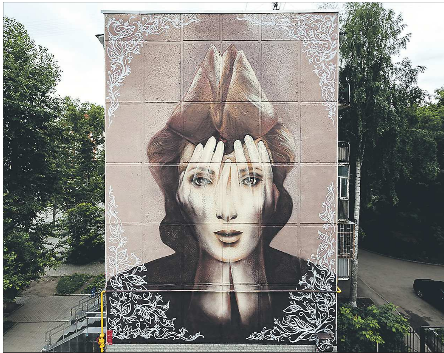
Фронтовичка, ул. Уральская, 60. Автор: Марина Ягода из Новосибирска. Год создания — 2015