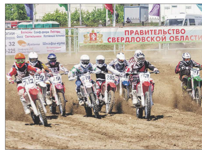
Чемпионат досрвал с празднованием дня города в Каменске-Уральском. Зрителей на трибунах было примерно столько же, сколько посмотрело трансляцию в Сети