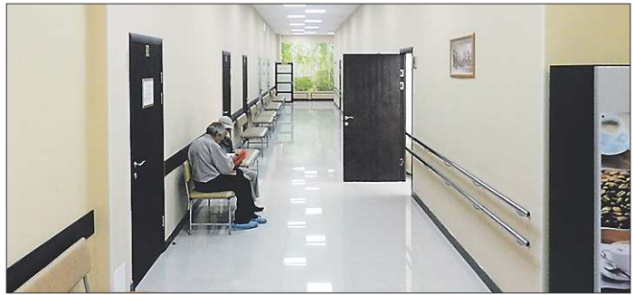
В новом центре широкие коридоры. Везде есть перила и пандусы