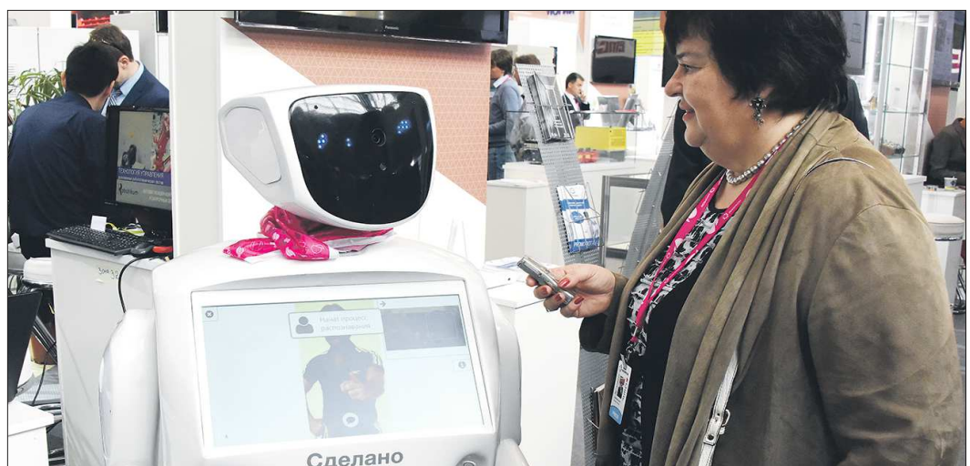
Некоторые ответы робота были вполне человеческими

Вчера, 10 июля, МВЦ «Екатеринбург-ЭКСПО», где сейчас проходит Иннопром-2015, посетил губернатор Свердловской области Евгений Куйвашев. Он пообщался с журналистами, освещающими выставку, и, в частности, ответил на вопрос корреспондента «ОГ»: — Заметьте большое внимание к нашей выставке со стороны иностранных деловых кругов. Несмотря ни на какие экономические санкции, введённые рядом стран Запада в отношении России, интерес к Иннопрому-2015 со стороны наших европейских и заокеанских партнёров не снизился. Они сейчас здесь, в Екатеринбурге, хотят развивать и строить бизнес вместе с нами. Кроме того, хочу подчеркнуть, что я очень благодарен председателю правительства России Дмитрию Медведеву за то внимание, которое он оказывает нашей выставке. В нынешнем году он уже в четвёртый раз посетил Иннопром. Во многом благодаря именно его усилиям эта выставка развивается хорошими темпами. Кстати, хочу обратить ваше внимание, что в нынешнем году вместе с премьер-министром приехала большая делегация руководителей самого высокого уровня — заместителей председателя правительства России и федеральных министров. Это говорит о том, что на уровне руководства страны есть заинтересованность в продвижении нашей выставки Татьяна БУРДАКОВА