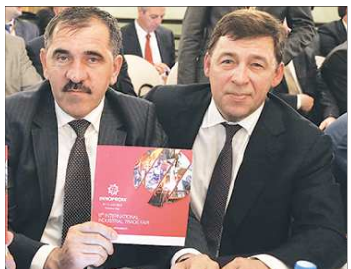
Юнус-Бек Евкуров (слева) поблагодарил Евгения Куйвашева за приглашение на Иннопром и выразил «отдельное спасибо» за гостеприимство»

— Договор действует во всех областях: в экономике, в культуре, в спорте. Но основной упор, конечно, сделан на промышленность. Здесь, на Иннопроме, находятся промышленники из Ингушетии, и их главная задача — налаживать связи, изучать опыт уральских коллег, искать новые возможности поставки наших товаров в Екатеринбург, организовывать поставки уральских предприятий к нам в республику, минуя посредников. — Подразумевает ли договор совместные производства? — В экономической части договора речь идёт только о торговых отношениях. У нас производят сейчас великоколпные полимерные трубы, до конца года будет закончена пусконаладка завода радиаторов, который сможет поставлять на Урал радиаторные батареи. В республике развивается производство энергосберегающих ламп. Ещё мы строим завод по производству автобусов, которые, надеюсь, тоже будут востребованы в вашем регионе. — В Екатеринбурге вы служили четыре года. Ка-