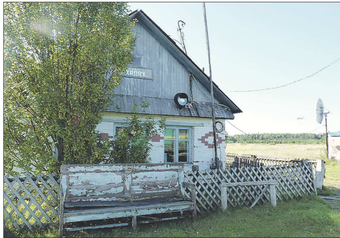
Вокзал в Калаче пустует. Оставшиеся 12 жителей посёлка надеются, что в середине июля поезд все-таки придёт