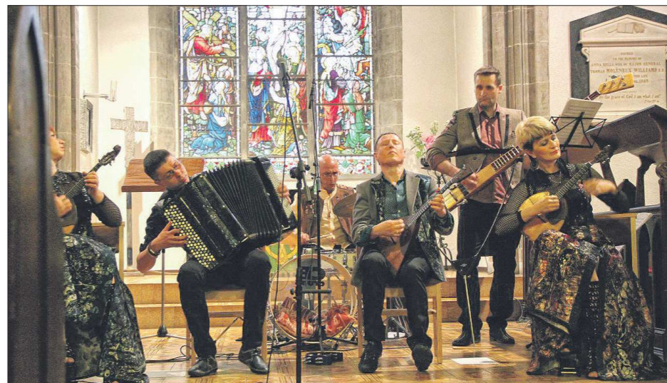
Ансамбль «Измурд». Концерт в замке XII века, Женева

– В основе, конечно же, была наша новая музыка – программа «Каверзы», премьера которой состоялась в начале апреля. Ну и, естественно, в таких поездках невозмож-