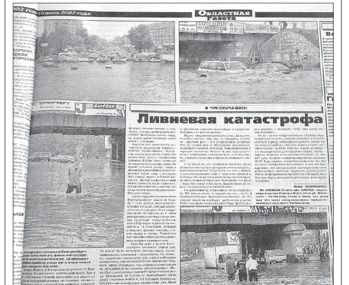
2002 год. Ливневки Екатеринбургa уже тогда не справлялись с потоком дождей, а с работы до дома приходилось добираться почти вплавь: «После непогодного, но обильного летнего ливня на улицы мегаполиса нельзя было смотреть без слёз. Улицы Ленина и Малышева на участке от Восточной до Луначарского напоминали море. Там и тут островками торчали автолюбители рядом со своими полузатопленными «железными конями»