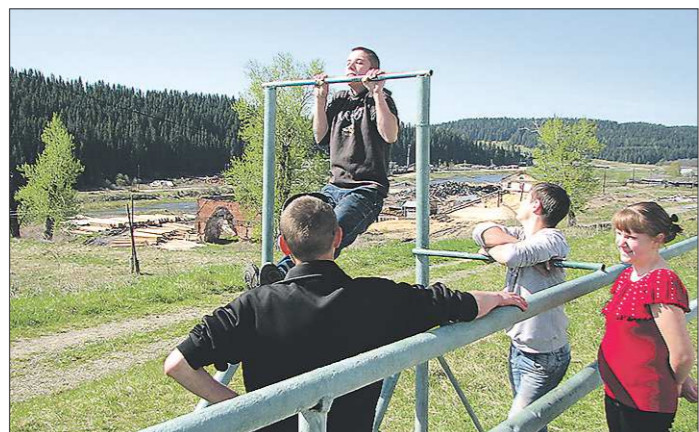
Этот турник — единственное, что было в Серебрянке для отдыха детей. Теперь здесь построят детскую площадку

Вчера председатель правительства Свердловской области Денис Паслер подписал распоряжение о выделении из областного резервного фонда 21,5 миллиона рублей на решение вопросов ЖКХ Ирбитского МО и переселение из ветхого жилья жителей Ивделя. Днём ранее 1,267 миллиона рублей выделены на оснащение образовательных учреждений Артёмовского, Невьянского, Нижнего Тагила и Богдановича. «ОГ» выяснила, что в последнее время с помощью резервного фонда удалось залатать немало «дыр» в местных бюджетах.