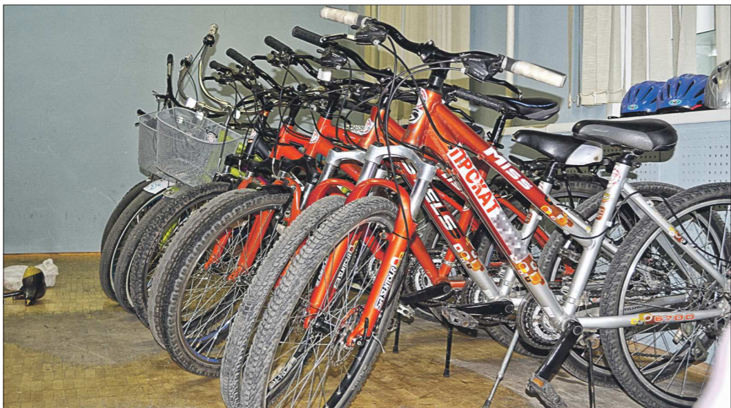
Как правило, центры проката предлагают клиентам либо горные, либо прогулочные велосипеды. Выглядит техника аккуратно, чисто, при езде не скрипит – за этим в большинстве прокатов внимательно следят. Но всё же, выбирая велосипед, стоит хорошенько осмотреть его на предмет поломок, чтобы в неисправности позже не обвинили вас

По данным администрации Екатеринбургa, в городе зарегистрированы 24 точки велопроката, кроме того, велосипед на время можно взять в некоторых хостелах и небольших гостиницах. Плюс велопрокаты, которые работают без уведомления властей – как в любом мелком уличном бизнесе, но цена, конечно, будет соответствующей. А час прогулки по городу стоит всего сто рублей – цена одна из самых низких в городе (самая высокая – 250 рублей за час, ин-