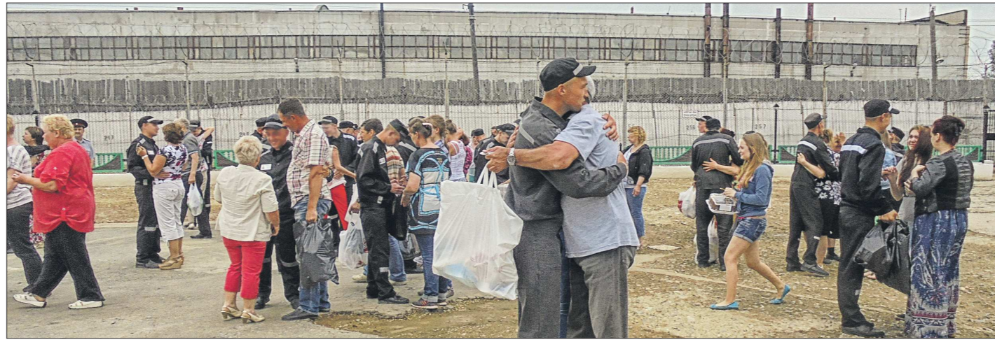
День открытых дверей, когда родственники осуждённых могут посетить территорию исправительного учреждения, прошёл в ИК №46 всего за две недели до акции протеста. Во время неё сюда зачастили совсем другие гости

Своей миссией сотрудники центра считают развитие дружественной социальной среды в родном районе. Они хотят, чтобы благополучие стало неотъемлемой нормой для всех его жителей.