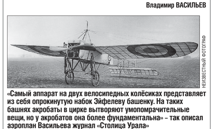
«Самый аппарат на двух велосипедных колёсиках представляет из себя опрокинутую набок Зигфеллеву башенку. На таких башнях акробаты в цирке вытворяют умопомрачительные вещи, но у акробатов она более фундаментальная» – так описал аэростал Васильева журнал «Столица Урала»

В соответствии с Федеральным законом от 03.11.2006 № 174-ФЗ «Об автономных учреждениях» и постановлением Правительства Свердловской области от 30.01.2009 № 64-ПП «Об утверждении форм отчётов о деятельности государственного автономного учреждения Свердловской области и об использовании закрепленного за ним имущества» ГАУ «Верхнетуринский ДИ» публикует отчет о деятельности государственного автономного учреждения и отчет об использовании имущества, закрепленного за государственным автономным учреждением, за 2014 год на портале www.pravo.gov66.ru в разделе: «Обязательная информация юридических лиц».