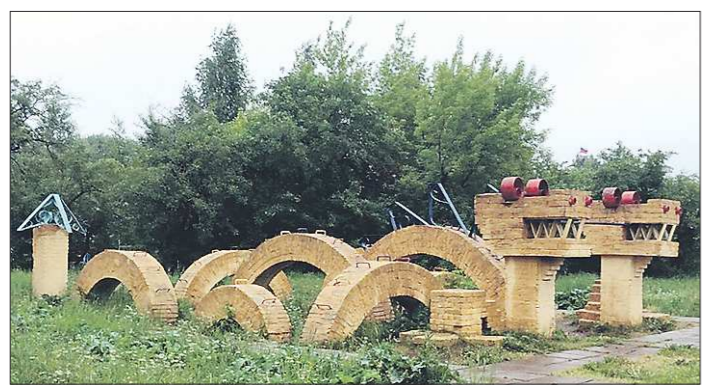
Многочисленные парковые преобразования не коснулись только кирпичного дракона, построенного ещё в советское время