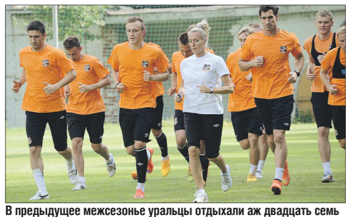
В предыдущее межсезонье уралцы отдыхали аж двадцать семь дней, а этим летом возобновили тренировки уже через две недели

Эталоном трудолюбия принято считать пчёл... «Шмели», как называют игроков нашей команды по имени клубного талисмана, дадут им фору. Уралцы изрядно потрудились, дабы не вылететь из «гнезда» премьер-лиги. По сумме двух стыковых матчей они переиграли томскую «Томь». Казалось бы: кто хорошо работает, тот хорошо отдыхает... Но екатеринбуржцы, затянув сезон аж до «переходников», сами урезали себе отпуск. 7 июня они провели заключительный матч, 22-го прошли обязательное углублённое медобследование и – пора на сборы.