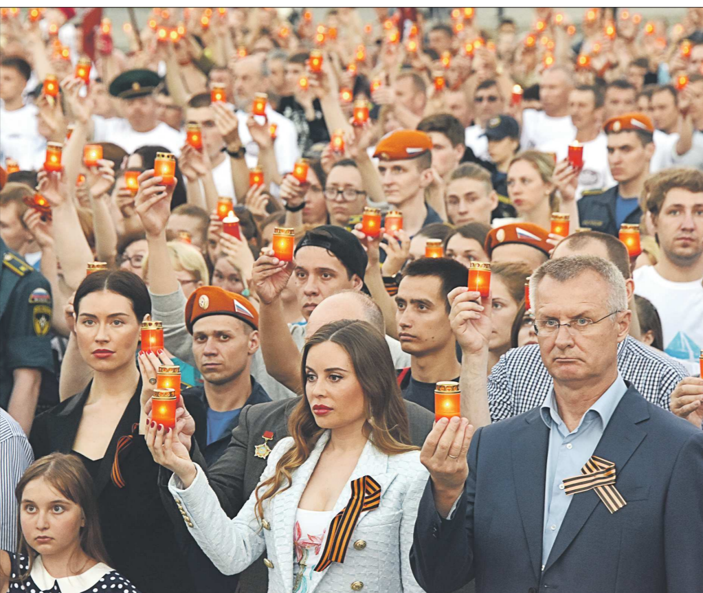
Тысячи свердловчан собрались 21 июня в Историческом сквере Екатеринбурга, чтобы почтить память жертв Великой Отечественной войны в рамках мемориальной акции «Свеча памяти: 22 июня». Ее участники с горящими свечами в руках выстроились в фразу «1941. Помним».