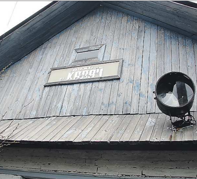
Калач — конечная станция Алапаевской узкоколейки. Поезд из Алапаевска до посёлка ходит три раза в неделю.

Помощь. От первого предложения сельчане наотрез отказались из-за цены вопроса: содержательные приборы пришлось бы за свой счёт.