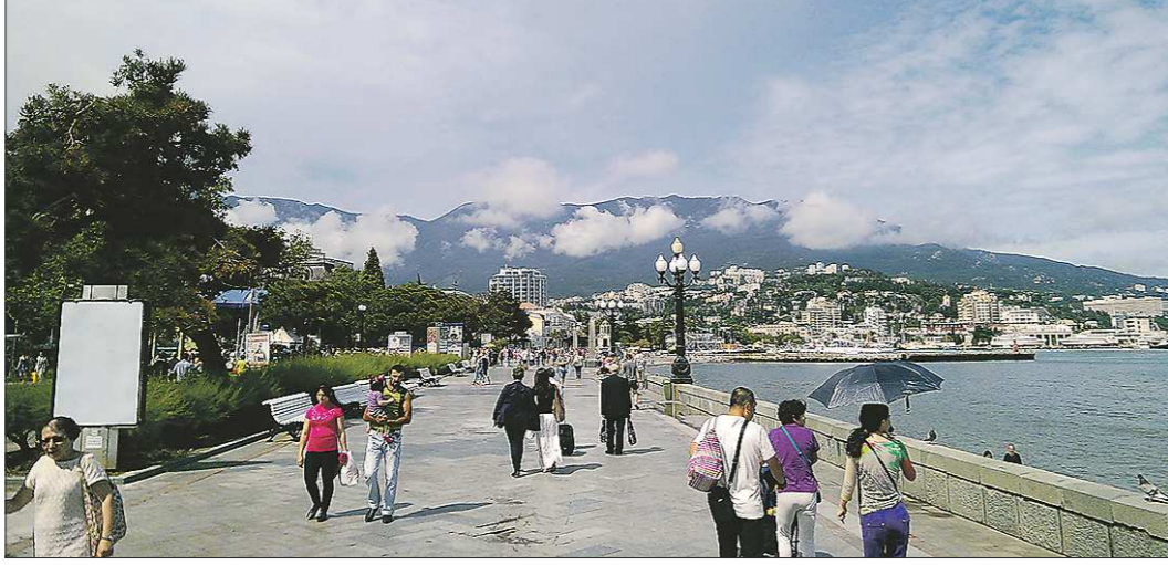
Для прогулок на набережной в Ялте есть все условия, даже бесплатный Wi-Fi

Перед отлётом мы начали всевозможных отзывов о курортах в Крыму и слегка расстроились. Туристы, отважись рвануть туда уже в майские праздники, писали гневные вещи: всё дорого, сервис отвратительный, и даже погода испортила отдых.