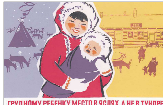
ГРУДНОМУ РЕБЁНКУ МЕСТО В ЯСЛЯХ. А НЕ В ТУНДРЕ Советский плакат, 1967 год.

Точно так же сохранились ясельные группы и ясли в других муниципалитетах — в Карпинске, Качканаре, Ирбите. В Карпинске обеспечены местами в дошкольных учреждениях около 70 процентов де-