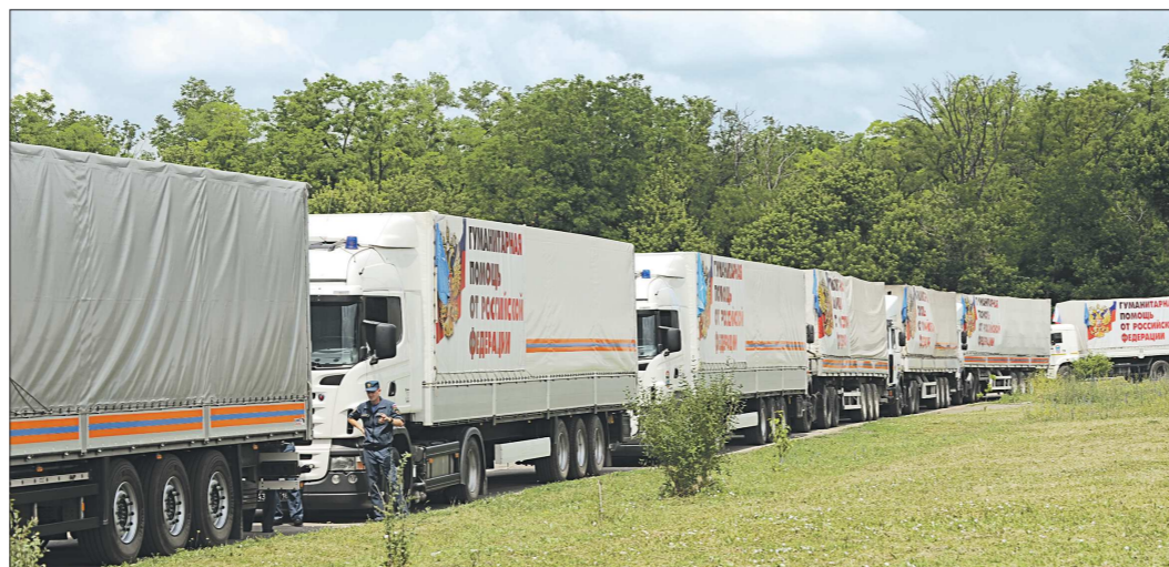
Украина объявила блокаду Донецку и Луганску, а Россия 18 июня направила уже 30-ю автоколонну с 20 тысячами тонн гуманитарных грузов для населения Донбасса

Впрочем, глава Украины отличился на прошедшей неделе и другими сомнительными высказываниями. 15 июня в интервью агентству «Блумберг» он заявил, что считает покупку Россией украинских еврооблигаций во времена президентства Виктора Януковича «взяткой» за отказ от вступления страны в ассоциацию с Евросоюзом (напомним, что в 2013 году