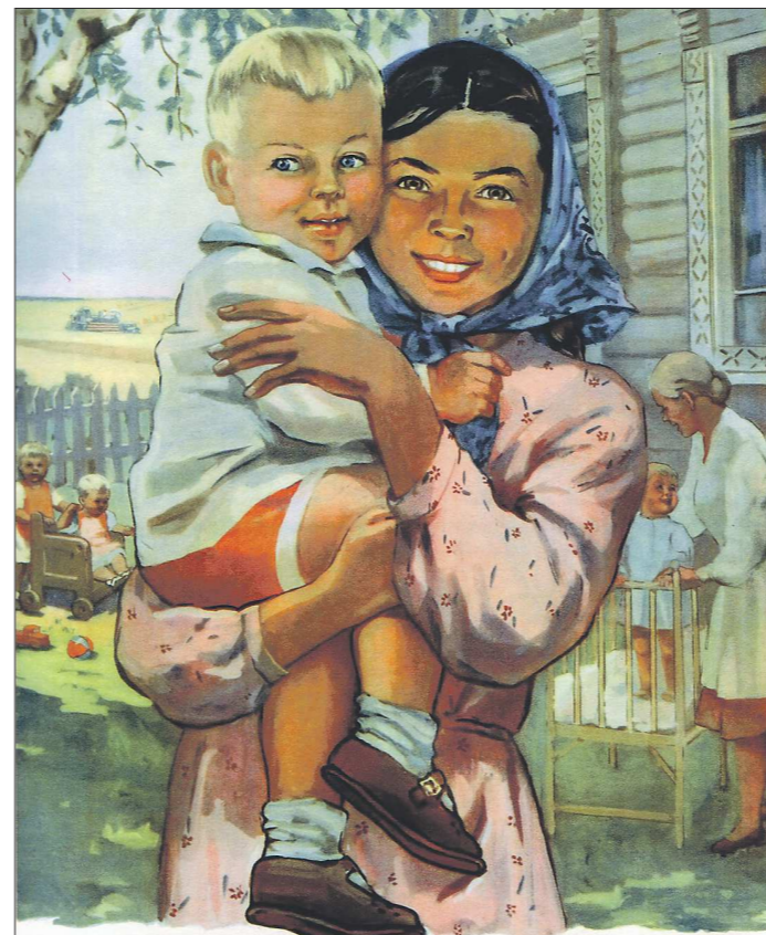
РАБОТАЮТ МАТЕРИ, СПОРИТСЯ ТРУД-КООПХОЗНЫЕ ЯСЛИ ДЕТЕЙ БЕРЕГУТ. Советский плакат, 1955 год

— Группы раннего возраста мы не закрывали никогда, — рассказывает начальник отдела по дошкольному образо-