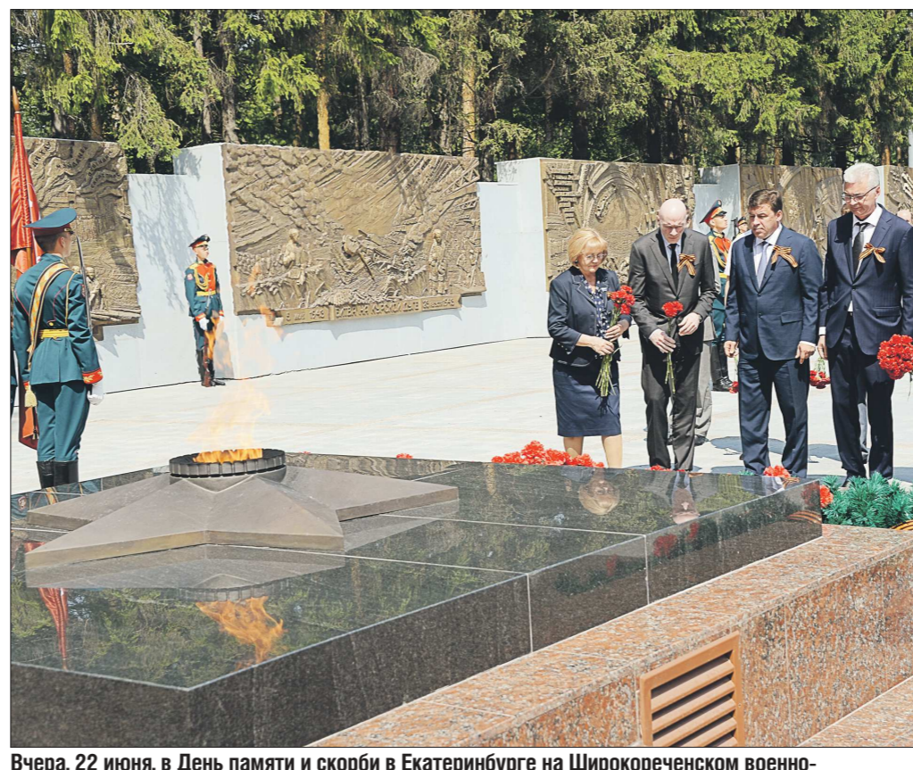
Вчера, 22 июня, в День памяти и скорби в Екатеринбурге на Широкореченском военно-мемориальном комплексе губернатор Свердловской области Евгений Куйвашев, председатель Законодательного собрания Людмила Бабушкина, глава администрации Екатеринбурга Александр Якоб, ветераны Великой Отечественной войны, герои тыла, представители религиозных конфессий и школьники возложили цветы к братской могиле солдат, умерших от ран в свердловских госпиталях