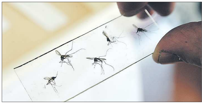
Изобилие комаров в Свердловской области отмечается второй год подряд

Причина появления большого количества кровососущих кроется в погодных условиях. Благоприятствует сочетание высокой температуры воздуха и повышенной влажности. Личинки комаров развиваются во влажных местах: