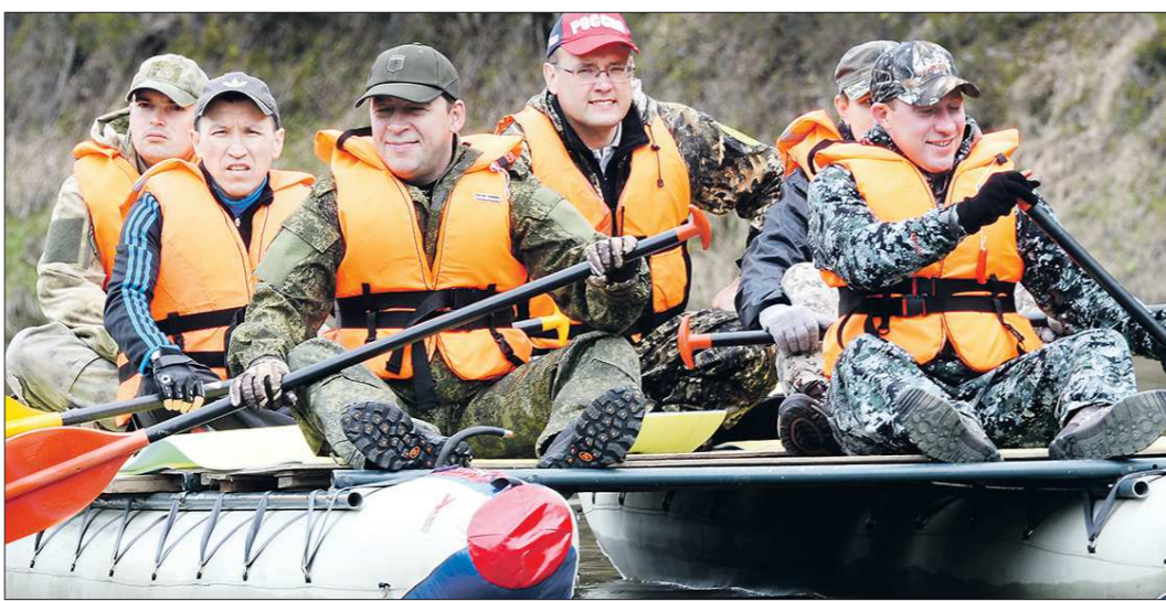
Сплав возглавили Евгений Куйвашев (слева на переднем плане) и Игорь Холманских (справа)

По весенней полноводной Чусовой сплавились в минувшую субботу, 23 мая, губернатор Свердловской области Евгений Куйвашев и полпред Президента РФ в УрФО Игорь Холманских. Конечно, не только ради прогулки они проехали больше двухсот километров от Екатеринбурга до деревни Усть-Утка. Прямо на берегу реки руководители встретились с лидерами всероссийского движения «В защиту человека труда» и обсудили проблемы и перспективы туризма на Урале.