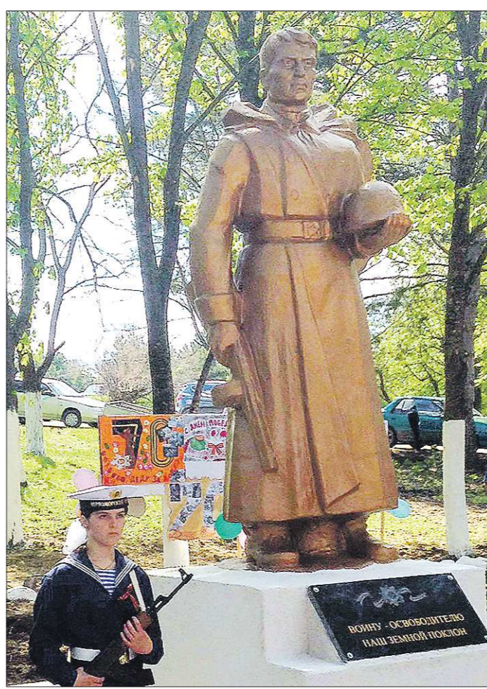
Памятник в селе Богатое хотели установить давно, но вопрос сдвинулся, когда за дело взялись уральцы