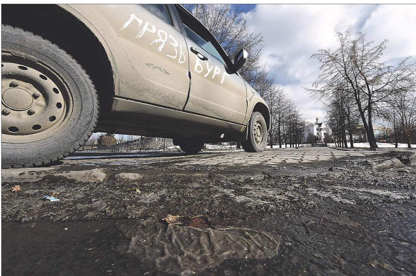
Машины из Екатеринбурга безошибочно узнаются в других городах России: в отличие от местных, они — грязные!