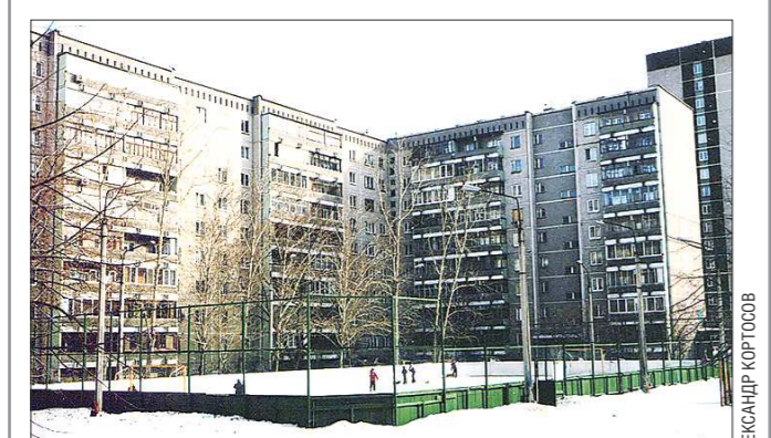
Согласно картам, дом по Черепанова, 12 (на фото) на несколько метров короче дома по Сыромолова, 7 — 507 метров против 515.