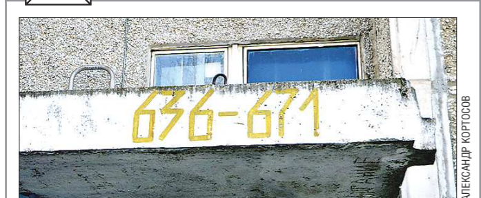
В доме на Черепанова 671 квартира, на Сыромолова на 10 меньше, поскольку в доме несколько арок