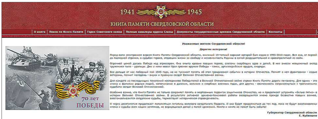
Вот так выглядит первая страница обновлённой электронной версии Книги Памяти

Издание региональных Книг Памяти в области началось, когда страна готовилась к 50-летию Великой Победы. С 1994 по 2010 год было издано 19 томов. В них собраны сведения о судьбах более чем трёхсот тысяч воинов-уральцев, погибших или пропавших без вести на фронте, приведён справочный материал о госпиталях, размещавшихся в Свердловске и других городах области в годы войны. В 19-м томе опубликована также информация о Героях Советского Союза и полных кавалерах орде-