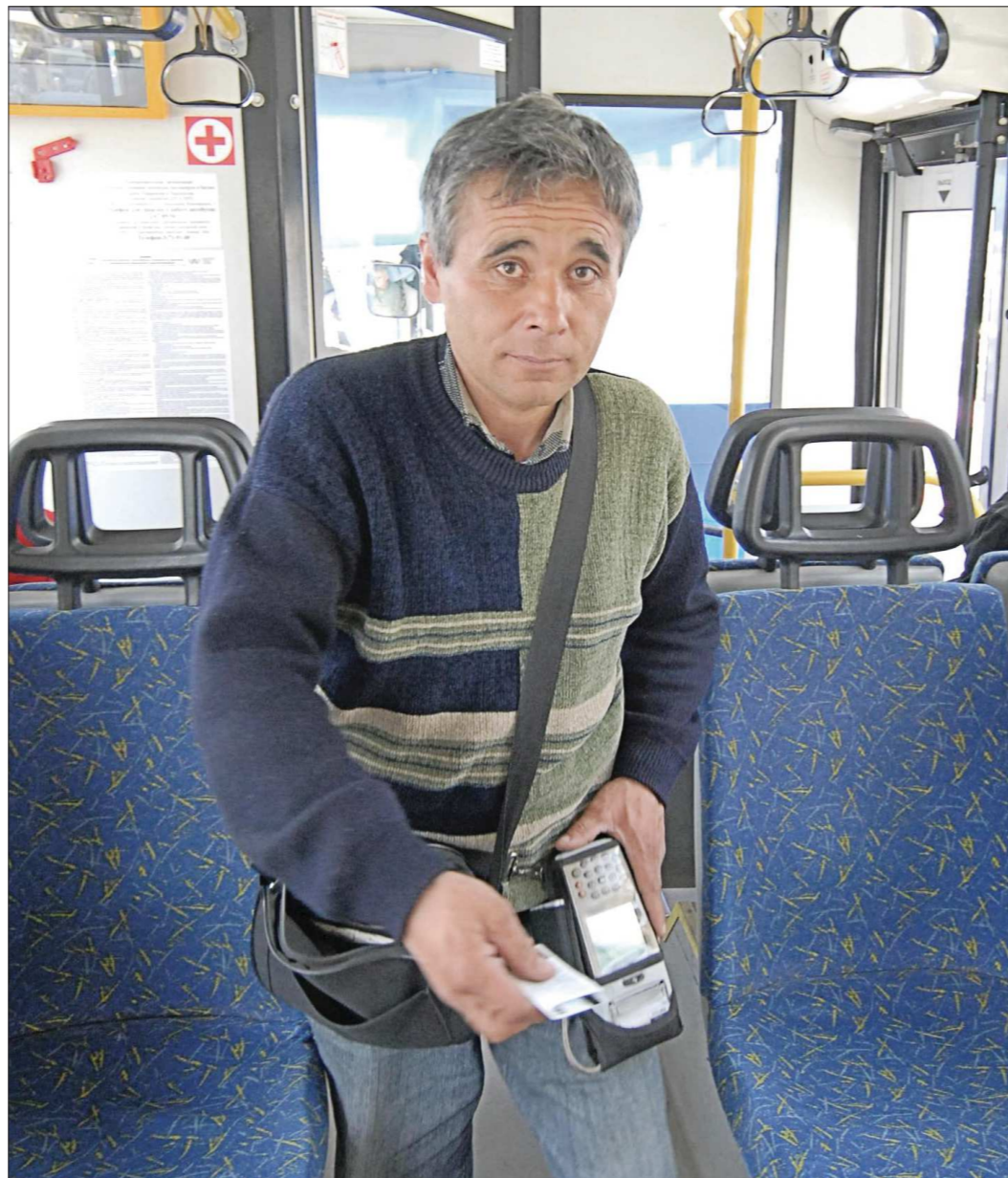
Представители Таджикистана, Узбекистана и Киргизии давно трудятся водителями и кондукторами в Екатеринбурге

– Вместо полиса добровольного медстрахования мигранты зачастую привозят всякие бумажки от никому не известных компаний, у которых нет договоров с