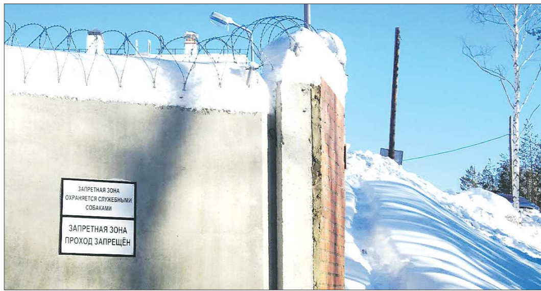
Решение о снятии с Новоуральска статуса ЗАТО пока не принято, президентский указ не подписан. Однако областные власти, атомщики и сам город делают всё, чтобы это произошло

— Референдум эта процедура не предполагает. Мы проводили неофициальные опросы, мнения разделились примерно 50 на 50. Сегодня больше 11 тысяч горожан заняты в сфере малого и среднего бизнеса. Конечно, им забор мешаёт, возникает сложность с пропусками на территорию ЗАТО,