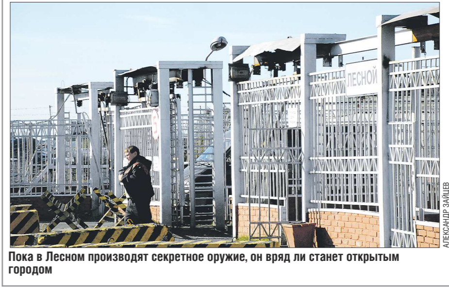
Пока в Лесном производят секретное оружие, он вряд ли станет открытым городом

грамма развития комбината и города, рассчитанная примерно на 11 миллиардов рублей — мы диверсифицируем нашу экономику. До 2018 года сокращения численности работников там не будет точно. И у нас нет тех проблем, которые встали перед Новоуральском при оптимизации основного производства, там из 17 тысяч работников осталось только три тысячи. Да, были некоторые проблемы с бизнесом — для него лучше, чтобы город открылся. Госдума на днях приняла закон о территориях опережающего развития, куда включены закрытые города. То есть в ЗАТО у предпринимателей будут налоговые льготы и другие серьёзные преференции. Но будут и ограничения: тот бизнес, который будет существовать в ЗАТО, не должен иметь «дочек» и филиалов, куда уходят деньги, у него не может быть иностранных собственников и так далее. Получается, что с основным производством вопрос решён, бизнес у нас будет жить по особым привлекательным законам, так зачем городу открываться?