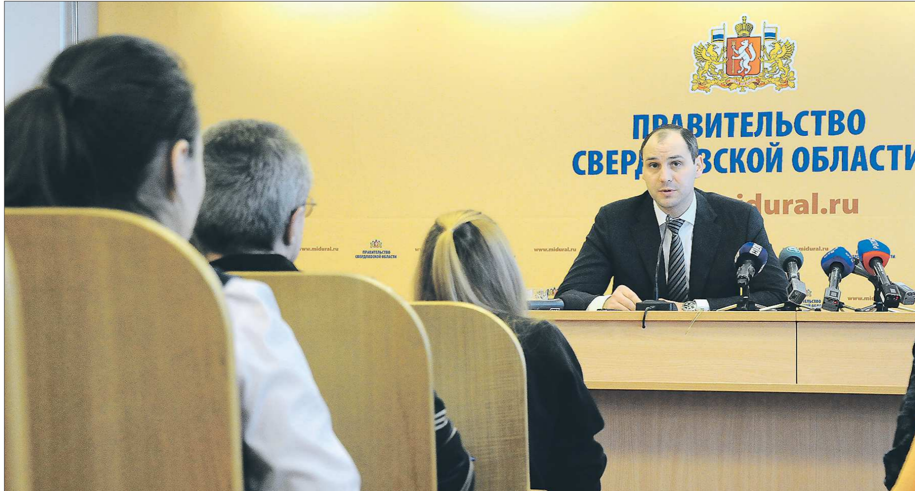
Денис Паслер уверен, что у федеральной и региональной власти есть полный набор инструментов, позволяющих оперативно влиять на ситуацию в экономике

В 2014 году на 27 процентов увеличился объём финансовой поддержки, оказываемой предприятиям региона через программы министерства промышленности и науки Свердловской области. На эти цели израсходовано 270 миллионов рублей. Мы считаем это направление очень важным. На 29 декабря у нас запланировано открытие технопарка «Университетский». Этот непростой объект возведён в кратчайшие сроки. Но мы возлагаем большие надежды на «Университетский». Ожидается, что в торжественной церемонии его открытия примет участие министр связи и массовых коммуника-