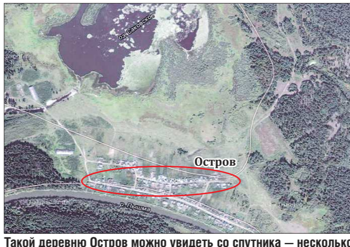
Такой деревню Остров можно увидеть со спутника — несколько десятков домов в окружении леса

— На Острове я родился и уезжать отсюда не планирую. Лавкой занимаюсь давно, надо же людей кормить. Возу продукты из Тюмени, беру самое