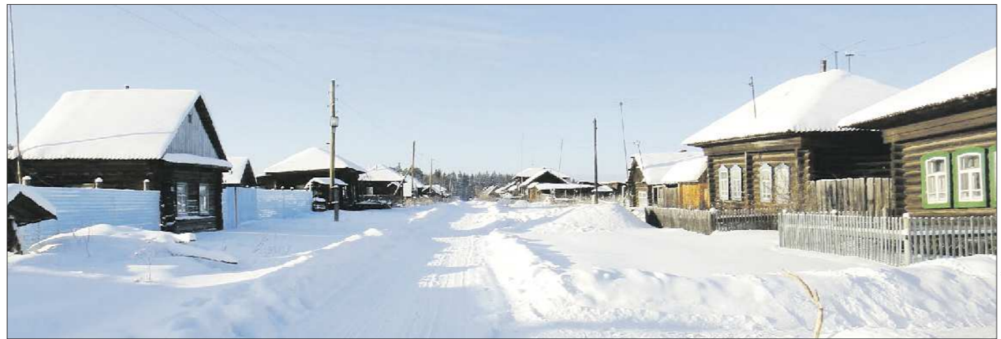
На Острове две улицы, которые многое говорят о расположении деревни: Приозёрная и Лесная

И почти везде — по инициативе местных жителей.