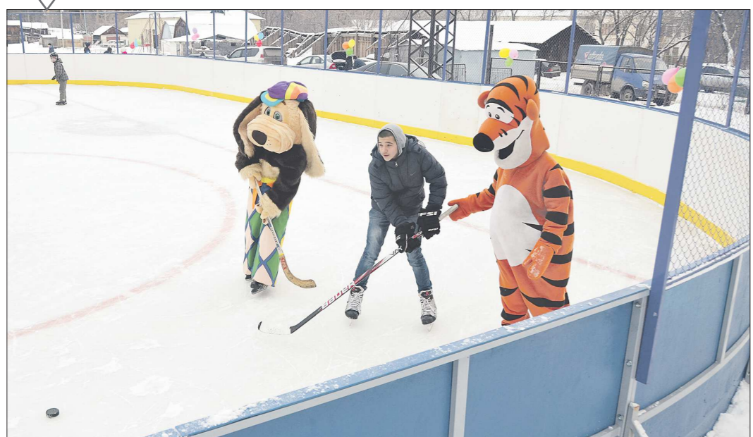
В Свердловской области – ледовый бум: всюду заливают катки, строят новые корты, восстанавливают старые... В минувшие выходные новый корт появился в посёлке Бобровском