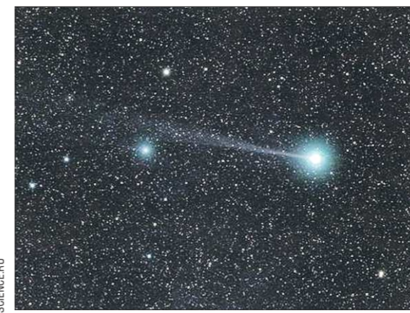
Комету C/2014 Q2 в бинокль можно увидеть уже сегодня ночью прямо над головой, в созвездии Ориона