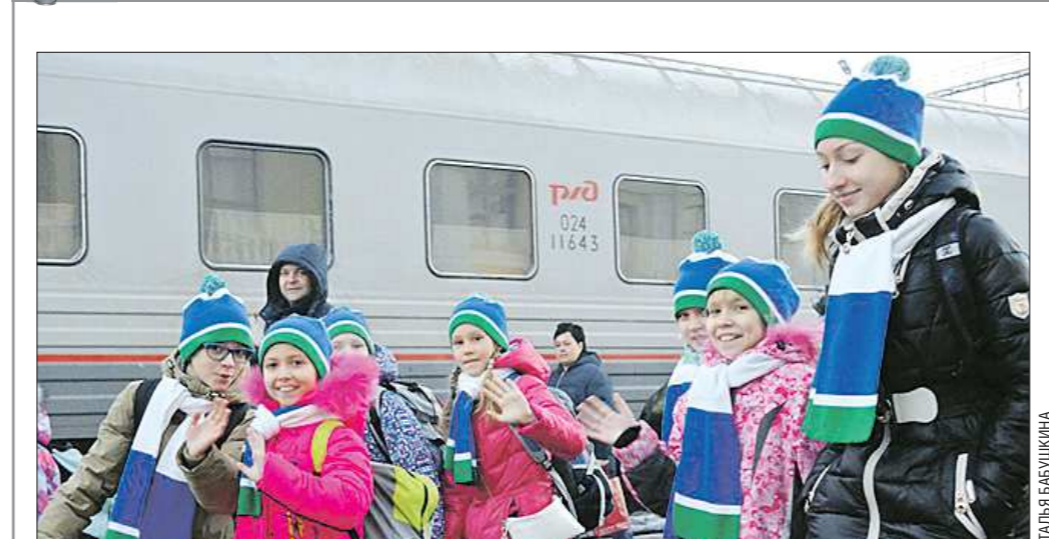
Вчера поезд №59 сообщением Екатеринбург — Москва повёз уральских детей на важное для них мероприятие — Кремлёвскую ёлку. Елку в Государственном Кремлёвском дворце, которая начнёт свои представления с 25 декабря, называют главным новогодним представлением. Её гостями в числе трёхсот тысяч ребят — столько гостей ежегодно она принимает уже много лет со всей страны — стали и 152 школьника из нашей области. В состав группы вошли дети различных категорий: сироты, дети из многодетных семей и семей участников боевых действий, а также отличники учёбы, призёры всероссийских олимпиад и конкурсов. Сопровождают их 37 взрослых. Детей обеспечили горячим питанием, водой, а также личной экипировкой. В программе праздника — анимированное представление, хороводы вокруг ёлки, и, конечно же, — сладкие подарки. Финансовые затраты на поездку (а это 1,5 миллиона рублей) взяло на себя правительство Свердловской области