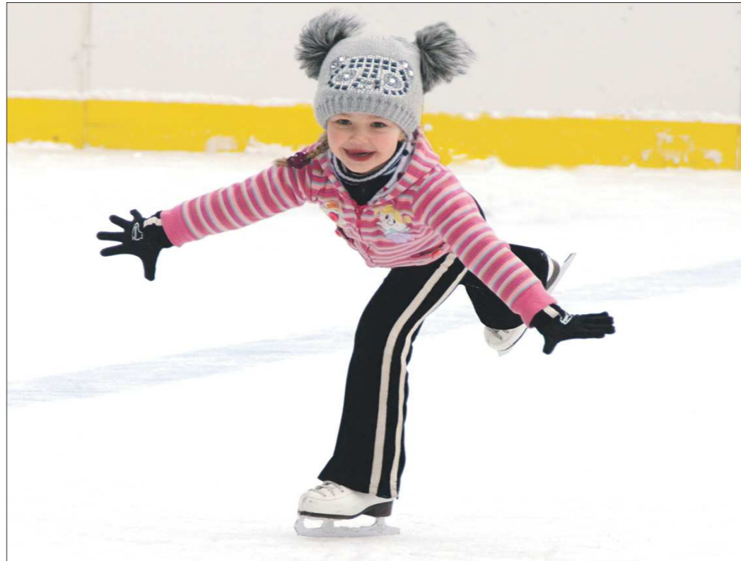
Новый корт в Бобровском сразу оценили даже самые маленькие сельчане. Кто знает, быть может, перед нами новая Юлия Липницкая?

В Серове тоже всеми силами пытаются увеличить количество ледяных площадок. Там впервые за последние пару лет залили лёд на стадионе «Локомотив», который переверели из ведения РЖД в муниципалитет и начали восстанавливать. Помимо катка сделали отдельную дорожку для конькобежцев и в начале декабря провели этап первенства Северного управленческого округа по конькобежному спорту — хороший повод для развития этого вида спорта в Серове.