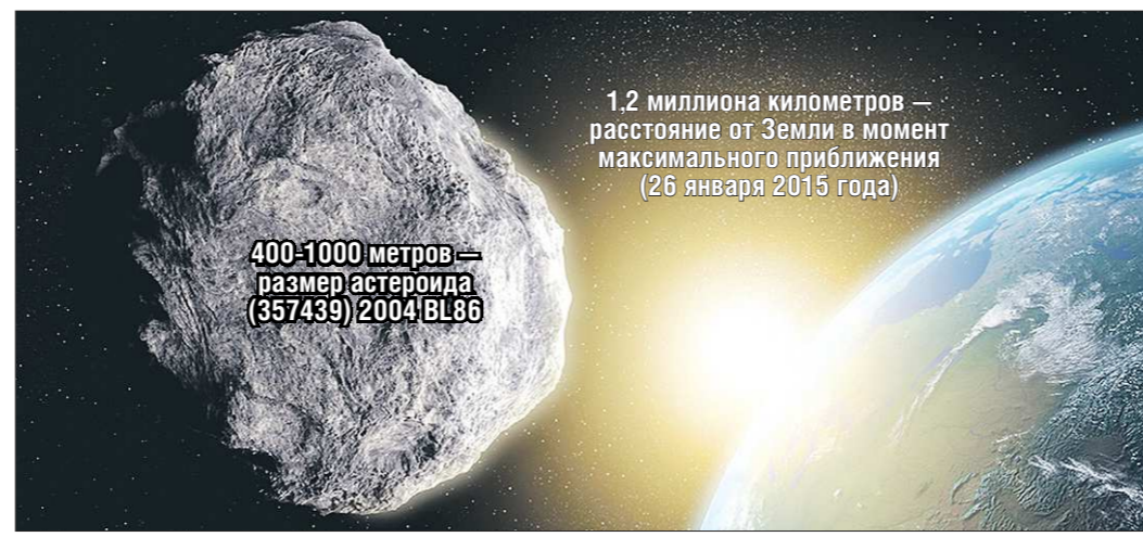
Посмотреть на астероид можно будет и в телескоп, и в обычный бинокль

Записали Станислав БОГОМОЛОВ, Лариса ХАЙДАРШИНА