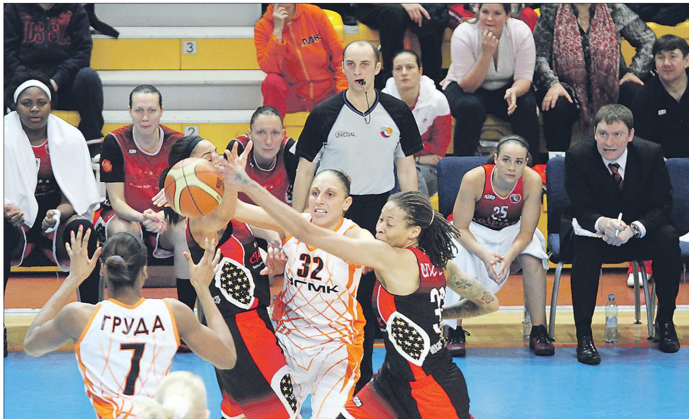
Интернациональный состав екатеринбургских «лисиц» укладывается в предписанный правительством норматив

Надо иметь в виду, что народ наш в массе своей по части законов небогатый, а из любопытных далеко не все внимательны. Вот и по поводу нового постановления сразу же поплыли слухи. Оно и понятно, если трудящиеся на