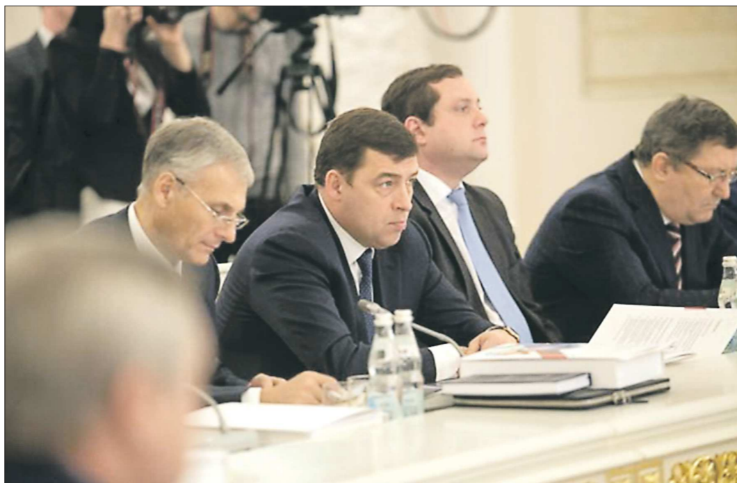
Как прозвучало на Госсовете, первые плоды новая государственная культурная политика должна дать в течение пяти лет

И всё же начинать придётся не с нуля. Например, в Свердловской области вопросы развития культуры всегда занимали особое место. За 2014 год, объявленный Годом культуры, удалось добиться существенных подвижек в отношении общества к культуре и восприятию уральцами культурных ценностей, в улучшении материально-технической базы учреждений культуры и повышении благосостояния работников учреждений культуры. Последнее, заметим, немаловажно. Как сообщает департамент информационной политики губернатора, по итогам 11 месяцев 2014 года средняя зарплата работников отрасли превысила 22 тысячи рублей, что на 33 процента больше по сравнению с прошлым годом и более чем на 69 процентов по сравнению с 2012 годом. В целом на развитие культуры из областного бюджета в 2014 году выделено 9 миллиардов рублей. Также область