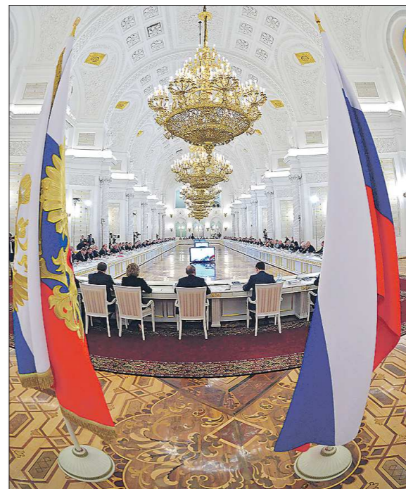
Президентский Указ в ближайшее время должен дополнить федеральный закон «О культуре в РФ»

будет курировать Академия русского балета имени Вагановой, что позволит вывести работу с юными талантами в сфере хореографии на самый высокий уровень. В повышении доступности культуры особое место занимает деятельность виртуального концертного зала Свердловской государственной академической филармонии. Это позволяет жителям небольших городов и поселков стать причастными к самым значимым событиям музыкальной жизни наравне со слушателями филармонического зала. Выросло количество виртуальных музеев, экскурсий и электронных музейных каталогов. В Год культуры губернатором было заключено соглашение с Эрмитажем