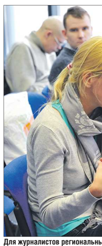
Для журналистов региональный парламент — источник самых актуальных новостей

Это значит, что мы сегодня делаем всё возможное, чтобы развитие экономики у нас продолжалось. Не могу не сказать об АПК. Несмотря на то, что Свердловская область находится в зоне рискованного земледелия, у нас очень многое делается для развития сельского хозяйства. Это особенно важно, когда мы говорим об импортозамещении. У нас строятся новые комплексы по выращиванию и содержанию крупного рогатого скота, свинопольские. Несмотря на то, что мы в своё время вложили в развитие этой отрасли, сегодня АПК даёт хорошую отдачу, благодаря которой будет прирастать наш областной бюджет.