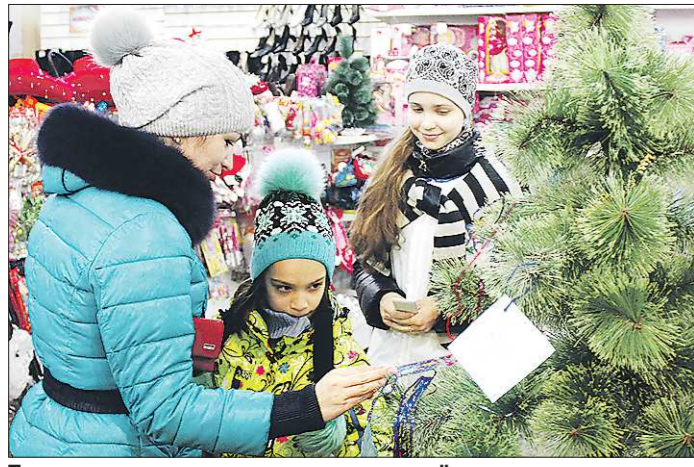
Помимо визитов на предприятия волонтеры проехали по местным магазинам и сумели привлечь к ёлке покупателей