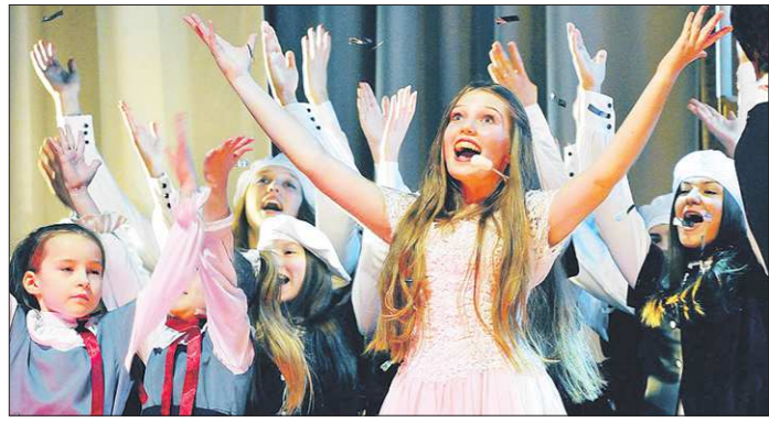
Сюжет первого спектакля Детского театра мюзикла частично основан на сказке Валентина Катаева «Цветик-семицветик». Волшебный цветок в этой постановке заменили веером, раскрашенным в цвета радуги