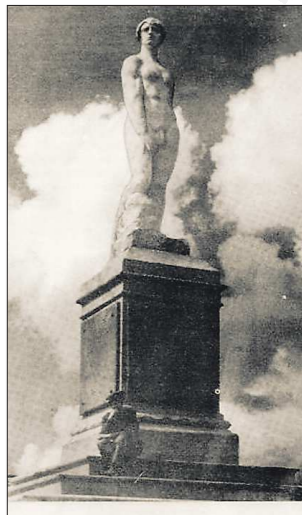
Памятник Освобождённому человеку работы Эрзя на площади 1905 года в Екатеринбурге. Был демонтирован в 1926 году

КСТАТИ. Эрзя так и не смог реализовать проект превращения скал в памятники, однако нечто подобное удалось американскому скульптору Гутзону Борглуму, который за 14 лет (с 1927 по 1941 год) превратил в памятники Джорджу Вашингтону, Томасу Джефферсону, Теодору Рузвельту и Аврааму Линкольну гору Рашмор в Южной Дакоте (США).