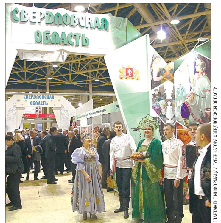
Победы в таких выставках приносят увеличение потока туристов в регион

Что касается стоимости квадратного метра жилья на первичном рынке, по данным аналитического центра УПН, сегодня она составляет в среднем 65,5 тысячи рублей. И ожидать снижения пока не приходится: застройщики жалуются, что себестоимость строительства растёт в том числе и из-за новых законодательных требований. Так, сейчас компании, которые заключают с гражданами договоры долевого участия, обязаны застраховать свою гражданскую ответственность. Страховка порой достигает десяти процентов стоимости объекта.