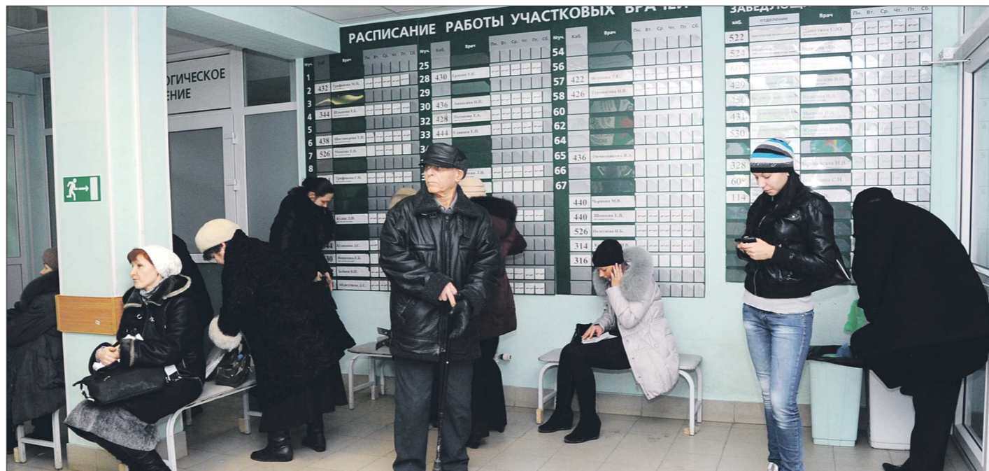
Пока ещё в больничных очередях — сначала в регистратуру, а потом к врачу — свердловчане проводят слишком много времени