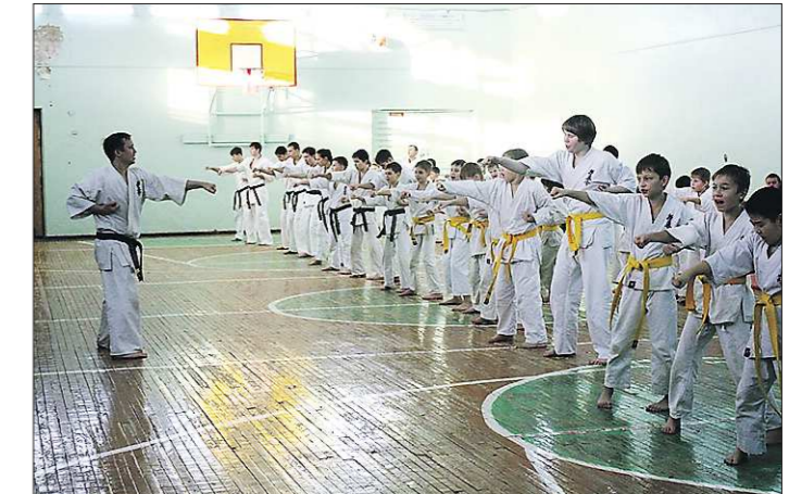
Сысертские каратисты занимаются боксом, так что старый пол доставлял вполне ощутимый дискомфорт