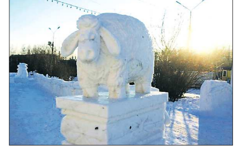
К утру понедельника последствия прихода вандалов были устранены: уши овечке — символу наступающего года — вернули