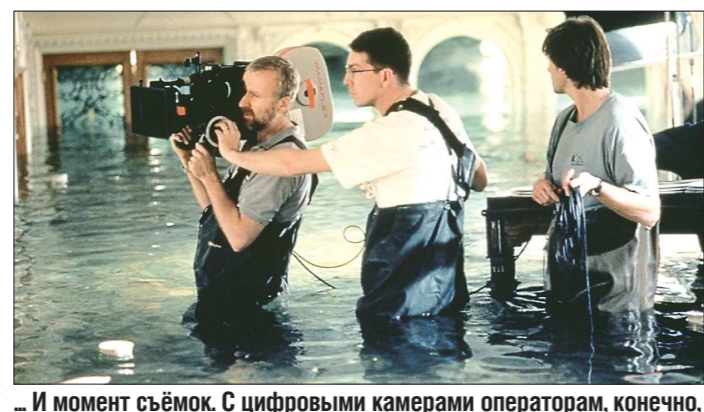
... И момент съёмки. С цифровыми камерами операторам, конечно, проще. Но кино, снятое на плёнку, обладает особым очарованием