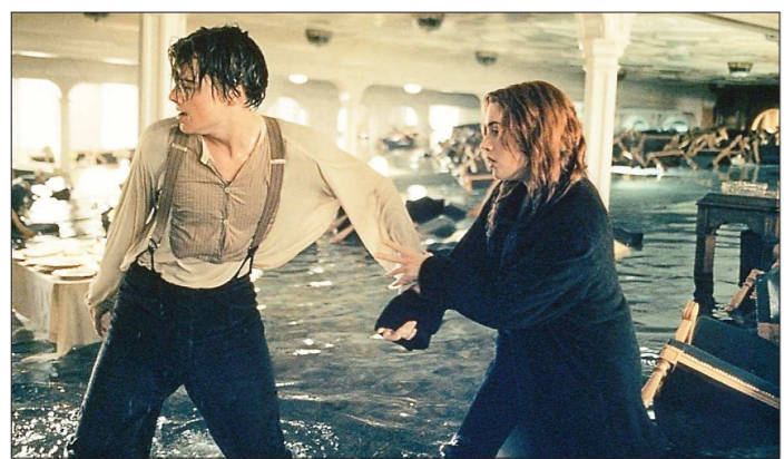
Кадр из фильма «Титаник»...