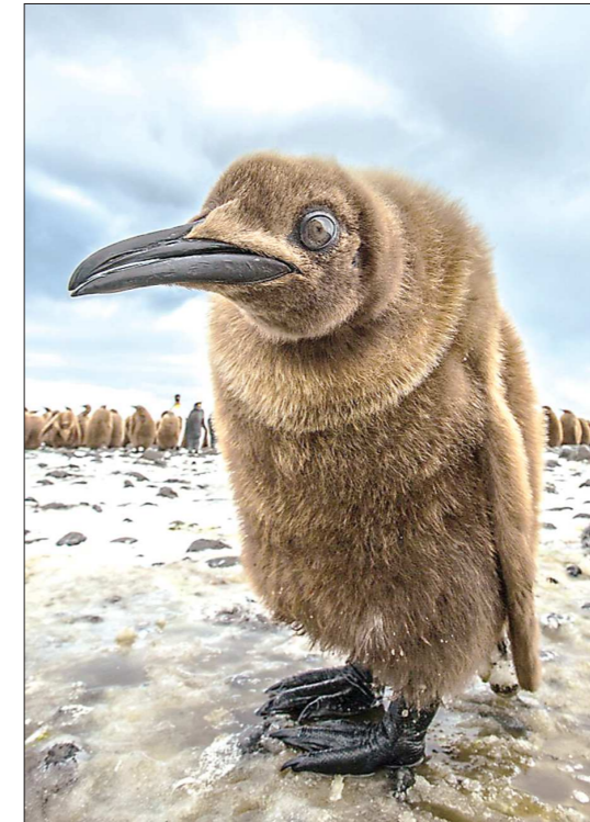
«Пока ещё гадкий пингвинёнок» – а в будущем королевский пингвин – запечатлён на острове Южная Георгия. Сначала пингвинята боялись фотографа, поэтому автору снимка пришлось ждать не один час, пока они привыкнут к чужаку и любопытство возьмёт верх над осторожностью...

тах делают уже совсем другие акценты. Всё меньше становится событийных фотографий, где, скажем, леопард гонится за антилопой. Сейчас, когда некоторые телеканалы круглыми сутками транслируют кадры из жизни диких животных, в этом просто нет необходимости. Теперь мастера с большим вниманием относятся к инструментарию фотографического языка – это сложная работа со светом, оптикой, композицией. Это визуально более сложные фото. Поэтому в фотографиях сегодня вы увидите чуть меньше природы, но чуть больше искусства. И при этом, как всегда на «Золотой черепахе», – ни капли фотомонтажа.