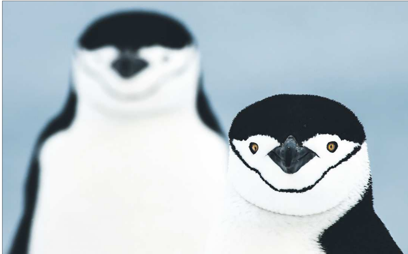
Пингвины очень редко смотрят прямо в камеру, поэтому фотографу пришлось очень долго выжидать момент, чтобы сделать этот редкий снимок