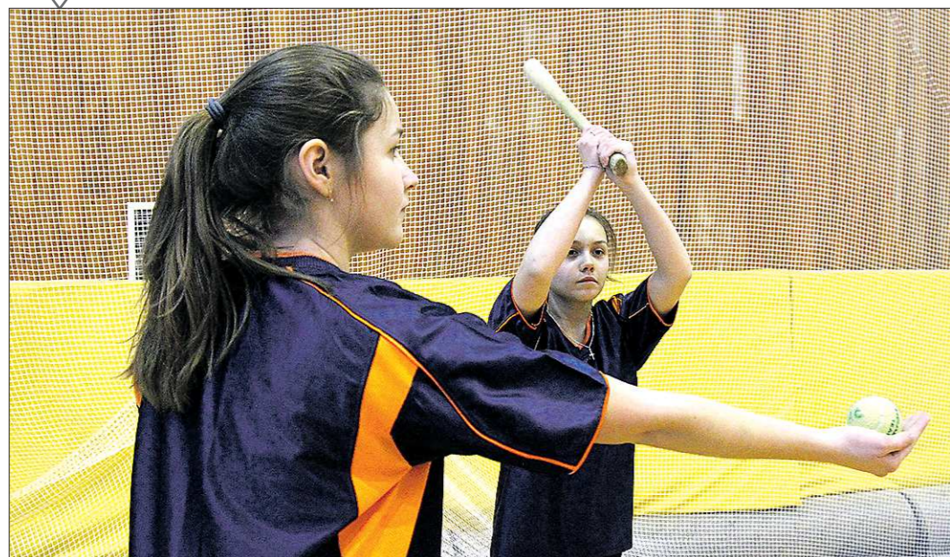
В минувшие выходные в Нижнем Тагиле прошло первое в нашей области масштабное соревнование по традиционной русской игре — лапте

«Наш ответ американскому бейсболу» >>> VIII