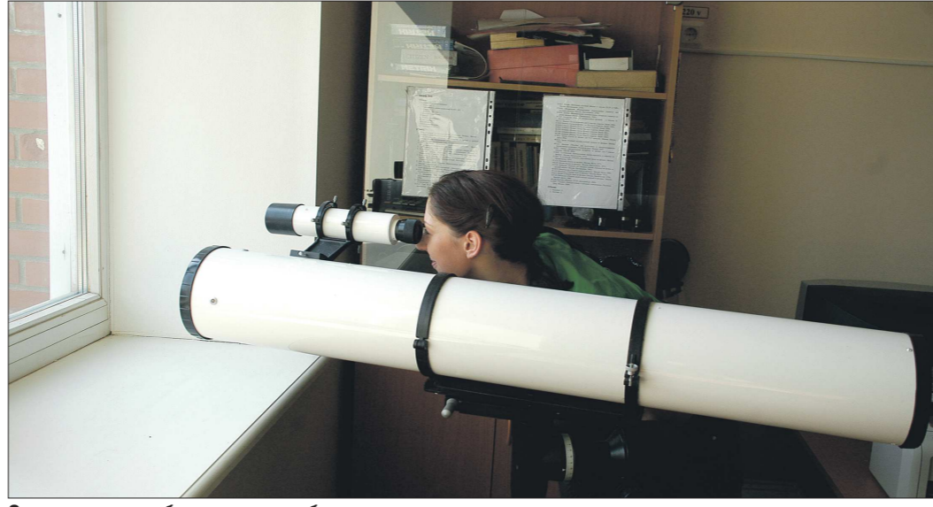
Сегодня дети наблюдают за небом в телескоп только в кружках