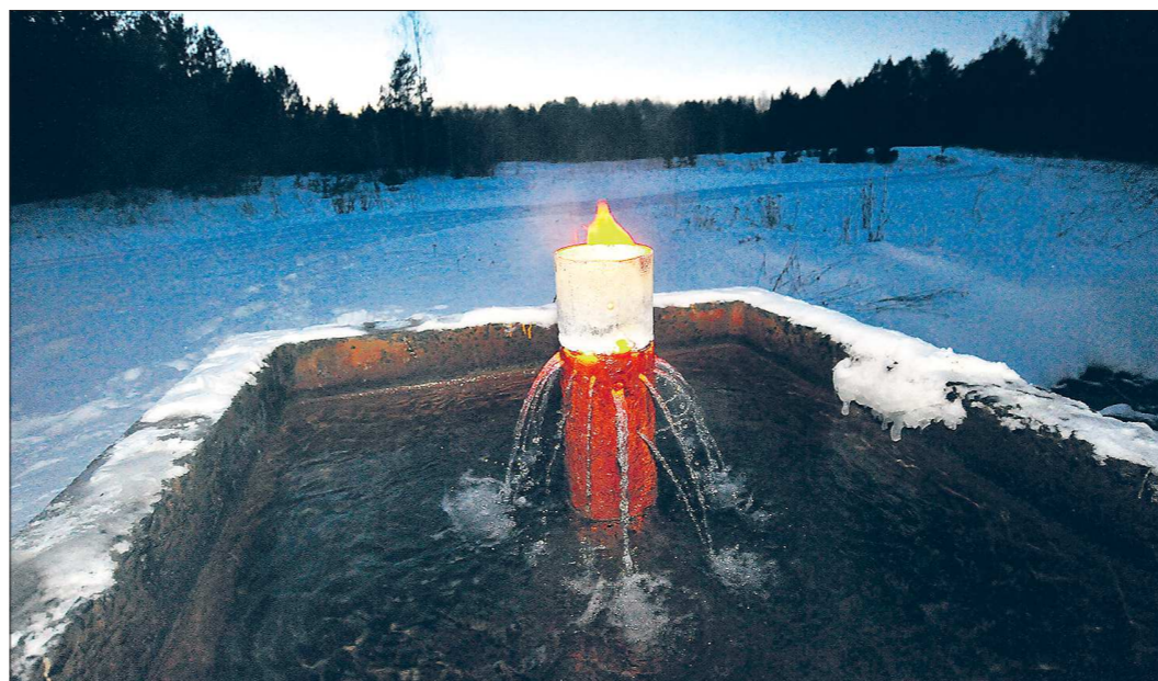
Вода не горит? В Махнёвском городском округе вам продемонстрируют абсолютно противоположное явление — горит, да ещё как, вот уже больше 50 лет. Правда, приспособить это чудо природы под нужды человека до сих пор никто не удосужился

«Наш ответ американскому бейсболу» >>> VIII