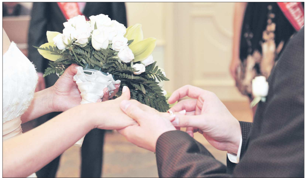
Поспешите подать заявление на свадьбу в этом году — и вам удачи сэкономить на пошлине