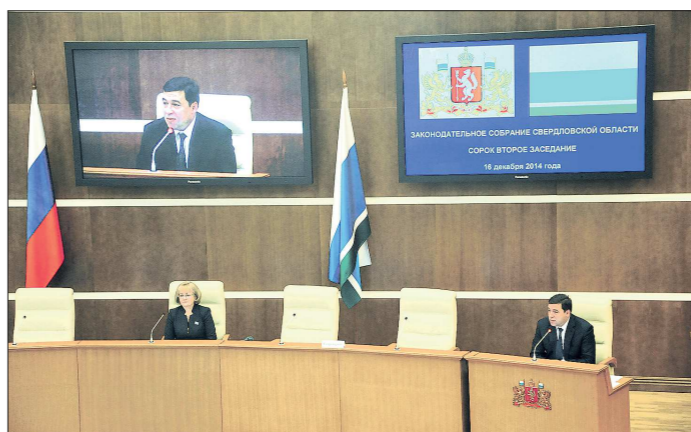
Евгений Куйвашев предложил областным депутатам активнее выступать экспертами в мониторинге эффективности действующих законов

Напомним, два года назад по этим показателям Сверд-